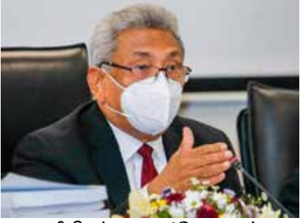
அரசிலிருந்து வெளியேறுவதற்கான அறிகுறிகளை அதன் பங்காளியான ஸ்ரீலங்கா சுதந்திரக் கட்சி வெளிப்படுத்தி

யுள்ளது. எனவே, அக்கட்சியினர் தொடர்பில் முடிவொன்றை எடுத்த பின்னரே அமைச்சரவையை மறுசீரமைக்க ஐனாதிபதி கோட்டாபய ராஜபக்ஷ தீர்மானித்துள்ளார் என ஊடகம் ஒன்று செய்தி வெளியிட்டுள்ளது.