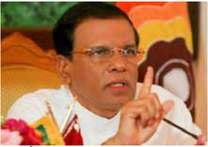
ஸ்ரீலங்கா சுதந்திரக் கட்சி உறுப்பினர்களின் வாய்க்குக்குப்பூட்டுப்போடுவதற்கு 'மொட்டு' கட்சியினர் முயற்சிக்கின்றனர். ஆனாலும், உண்மைகளைக் கதைப்பதற்கு நாம் தயங்கமாட்டோம்.