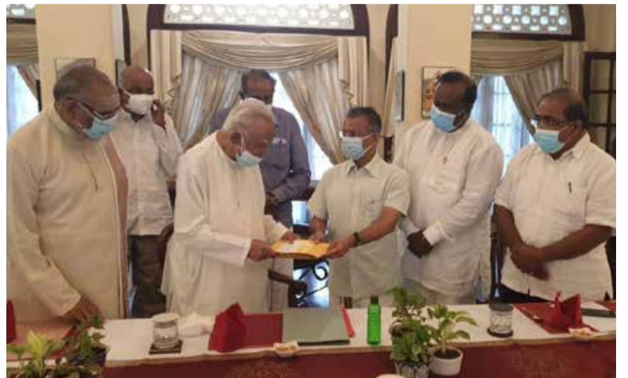
தமிழர் தரப்பின் கடிதம் கொழும்பில் இன்று மாலை இந்தியத் தூதுவரிடம் ஒப்படைக்கப்பட்டபோது.....