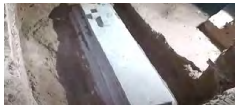
நிர்மாணப் பணிகளுக்காக நிலம் தோண்டப்பட்டபோது இந்த

கொழும்பு, ஜன. 19 வென்னப்புவ பகுதியிலுள்ள தேவாலயம் ஒன்றில் முன்னெடுக்கப்பட்ட கட்டட நிர்மாணப் பணிகளின்போது பழமையான கல்லறையொன்று கண்டுபிடிக்கப்பட்டுள்ளது. வென்னப்புவ-போலவத்த பரலோக அன்னை தேவாலயத்தின் கட்டட நிர்மாணத்துக்கான அகழ்வின்போதே பழமையான கல்லறையின் சிதைவுகள் வெளிப்பட்டுள்ளன. தேவாலயத்துக்கு அருகே