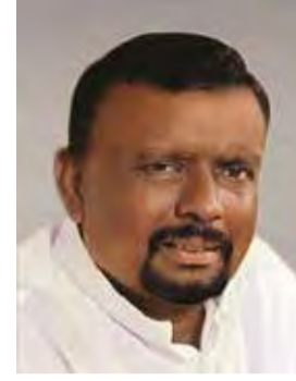
நன்மை பயக்கவில்லை. மொட்டு கட்சியால்தான் சுதந்திரக்கட்சி பயன் அடைந்தது. எம்முடன்