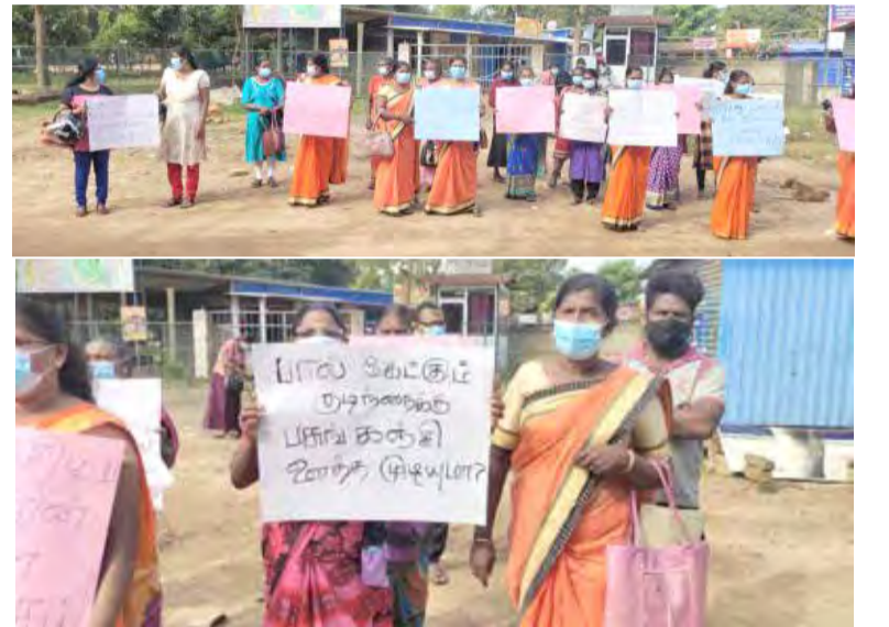
களை எதிர்கொண்டு வருவதாகவும், அதற்கு ஏற்ற வகையில் அரசாங்க அதிபர் நடவடிக்கை எடுக்கவேண்டும் எனவும் இதன்

நாட்டில் தற்போது உள்ள பொருட்களின் விலை அதிகரிப்பால் மக்கள் பெரும் சவால்