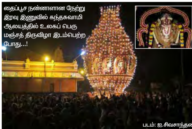
தைப்பூச நன்னாளான நேற்று இரவு இணுவில் கந்தசுவாமி ஆலயத்தில் உலகப் பெருமஞ்சத் திருவிழா இடம்பெற்ற போது...!

உறுப்பினர்கள் புறக்கணித்துள்ளனர். நேற்று பாராளுமன்றில் இடம்பெற்ற ஜனாதிபதியின் கொள்கை விளக்க உரையில் தமிழ் மக்களின் இனப்பிரச்சனை, 15