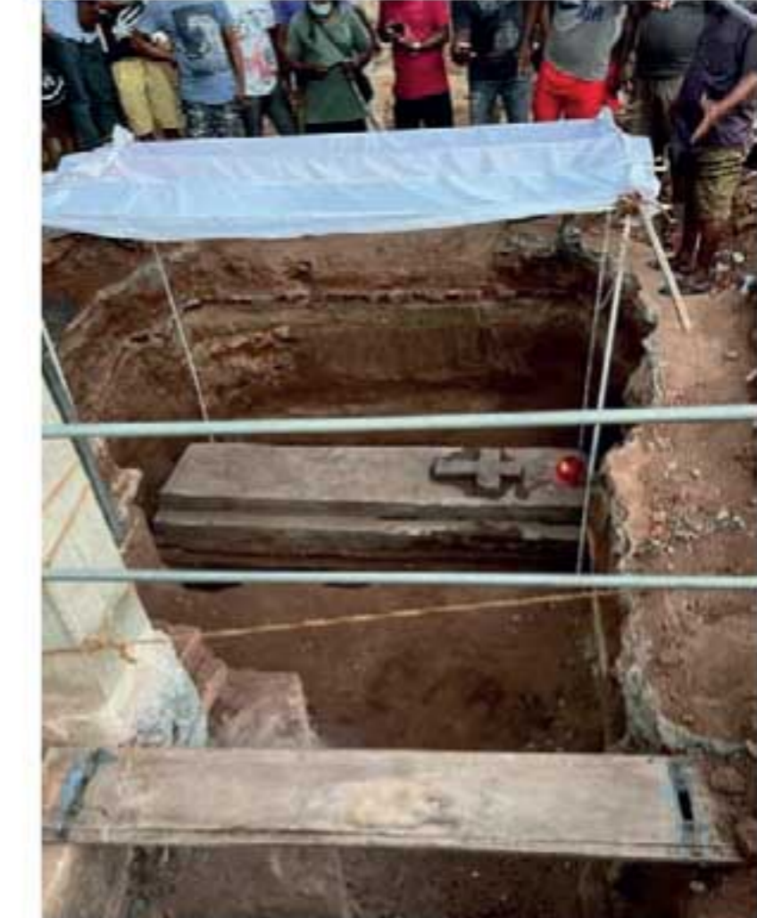
ஒருவருடைய சடலம் புகைக்கப்பட்டுள்ளது. இது தொடர்பில் தேவாலயத்தின் பங்கு

வென்னப்புவ-போலவத்த பிரதேசத்திலுள்ள பரலோக ராஜ்ய தேவாலய வளாகத்திலிருந்து மிகவும் பழையமயான மயானம் ஒன்று கண்டுபிடிக்கப்பட்டுள்ளது. குறித்த தேவாலய வளாகத்தில் அமைப்பதற்கு திட்டமிடப்பட்டிருந்த கூட்டமொன்றுக்காக, அத்திவாரம் வெட்டும் பணிகள் முன்னெடுக்கப்பட்ட போதே, இந்த மயானம் கண்டுபிடிக்கப்பட்டுள்ளது. நிலத்திலிருந்து 3 அடி ஆழத்தில், கொள்கிரீட்டுகளால் தயாரிக்கப்பட்ட சுவக்குழியில்,