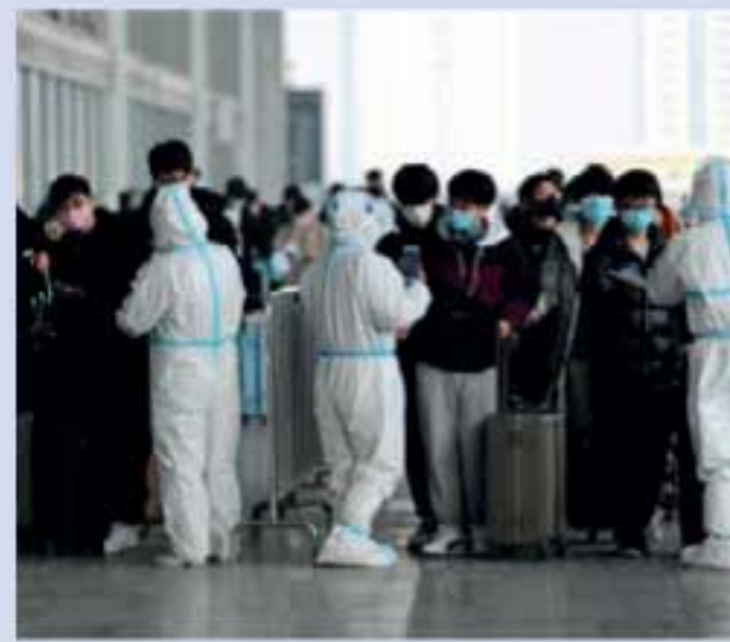
உறைகளில் மாதிரிகளைச் சேகரித்துள்ளதாகவும், மேலும் அந்த உறைகளில் நடத்தப்பட்ட நியூக்ளிக் அமில சோதனையிலும் ஓமிக்ரான் தொற்று உறுதியானதாகச் சீன அதிகாரிகள் தெரிவித்துள்ளன.

சீனாவில் நாட்டில் ஓமிக்ரான் தொற்றுப் பரவலுக்கு வெளிநாடுகளில் இருந்து வந்த தபால்களை காரணம் என சீனா குற்றம் சாட்டியுள்ளது. சீனாவில் அடுத்த மாதம் குளிர்கால ஓலிம்பிக் போட்டிகள் நடைபெறவுள்ளன. இந்நிலையில் கனடாவில் இருந்து அமெரிக்கா, ஹொங்கொங் வழியாக பெய்ஜிங்கிற்கு அனுப்பப்பட்ட சர்வதேச தபால் ஒன்றில் ஓமிக்ரான் வைரஸ் இருந்ததாக சீனா தெரிவித்துள்ளது. இதற்காக சர்வதேச தபால்