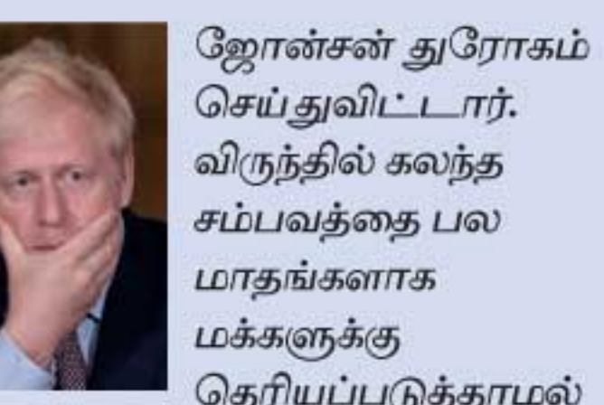
ஜோன்சன் துரோகம் செய்துவிட்டார். விருந்தில் கலந்த சம்பவத்தை பல மாதங்களாக மக்களுக்கு தெரியப்படுத்தாமல் மறைத்துள்ளார். அவர் இராஜினாமா செய்ய வேண்டும்" என்று நாடாளுமன்ற உறுப்பினர்கள் வலியுறுத்தியுள்ளனர். எனினும் குறித்த விருந்துபார நிசுத்தவொன்றில் கலந்துகொண்டதாக போரிஸ் விளக்கம் அளித்துள்ள போதும் அவரது விளக்கம் ஏற்றுக்கொள்ளப்படவில்லை. இந்நிலையில் பிரித்தானியாவின் அடுத்த பிரதமராக வரும் வாய்ப்பு இந்திய வம்சாவளியை சேர்ந்த ரிஷி சுனாக்கிற்கு கிடைக்கும் என்றும் தகவல்கள் வெளிவந்துள்ளன. 41 வயதாகும் ரிஷி சுனா, பிரிட்டனின் நிதியமைச்சராக பொறுப்பில் உள்ளார் என்பதும் குறிப்பிடத்தக்கது.

விருந்தொன்றில் கலந்து கொண்ட காரணத்திற்காக பிரித்தானியாவின் பிரதமர் போரிஸ் ஜோன்சன் தனது பிரதமர் பதவியை இழக்கும் நிலைக்குத் தள்ளப்பட்டுள்ளதாகத் தெரிவிக்கப்பட்டுள்ளது. கொரோனாவால் மிக அதிகமாகப் பாதிக்கப்பட்ட நாடுகளில் பிரித்தானியாவும் ஒன்று. குறிப்பாக கடந்த வருடம் அந்நாட்டில் கொரோனாத் தொற்றுப் பரவலானது தீவிரமடைந்து காணப்பட்டது. இக்காலகட்டத்தில் பிரதமர் போரிஸ் விருந்துபார நிசுத்தவொன்றில் கலந்துகொண்டதாக அவரது முன்னாள் ஆலோசகர் வெளியிட்ட தகவலானது அந்நாட்டில் பெரும்பரபரப்பை ஏற்படுத்தியிருந்தது. இதனையடுத்து நாடாளுமன்றத்தில் இந்த விவகாரம் பேசப்பட்டபோது, "மக்களுக்கு போரிஸ்