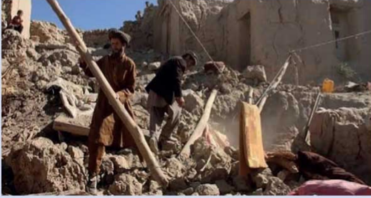
சிக்கியவர்களை மீட்கும் பணி தொடர்ந்து நடைபெறுவதால் உயிரிழப்பு அதிகரிக்கும் அச்சம் ஏற்பட்டுள்ளதாகவும் அந்நாட்டு ஊடகங்கள் தெரிவித்துள்ளன.

ஆப்கானிஸ்தானில் அடுத்தடுத்து நிகழ்ந்த இரண்டு நிலநடுக்கங்களால் ஏற்பட்ட கட்டிட இடிபாடுகளில் சிக்கி உயிரிழந்தவர்களின் எண்ணிக்கை 26 ஆக அதிகரித்துள்ளது. அந்நாட்டின் மேல் மாகாணமான பட்டகானில் நேற்று முன்தினம் (17) நண்பகல் 2 மணி மற்றும் மாலை 4 மணியளவில் இந் நிலநடுக்கம் ஏற்பட்டதாகவும், இது ரிசுட்ர் அளவு கோலில் அதிகபட்சமாக 5.3 ஆகப் பதிவாகியுள்ளதாகவும் தெரிவிக்கப்பட்டுள்ளது. மேலும் இடிபாடுகளில்