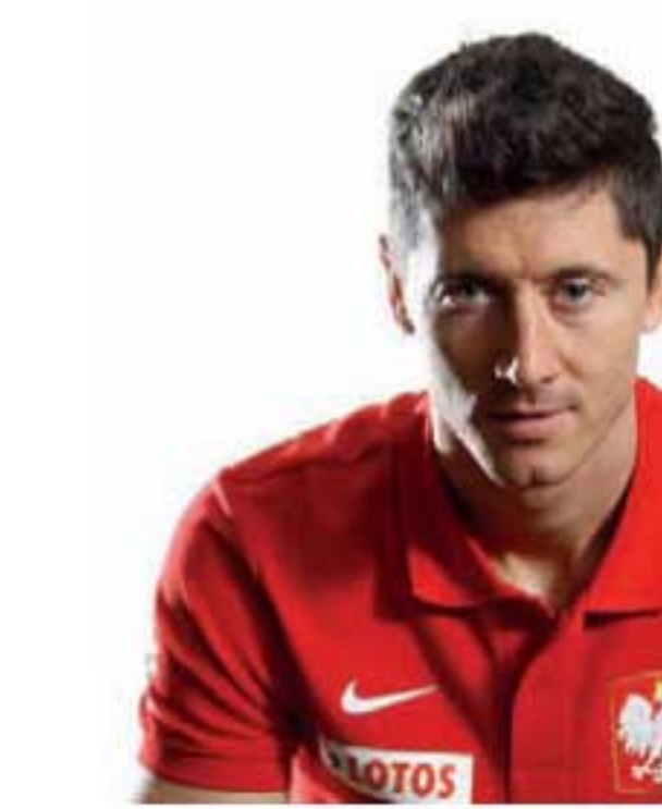
சிறுந்த வீரராகவையாகத் தெரிவாகியிருந்தார். இதேவேளை, இத்தாலிய சர்வதேச கால்பந்தாட்ட அணியின் பயிற்சியாளரான றொபேர்ட்டோ மன்சினி, பிரீமியர் லீக் கழகமான மன்செஸ்டர் சிறுநியின் முகாமையாளர் பெப் குவார்டியோவைத் தாண்டி, சிறுந்த பயிற்சியாளராக இன்னொரு

சர்வதேச கால்பந்தாட்டச் சம்மேளனத்தின் சிறுந்த வீரராக, ஜேர்மனியின் புண்டெலிஸ்கா கழகமான பரேன் மியூனிச்சின் றொபேர்ட் லெவன்டோஸ்கி நேற்று முன்தினம் தெரிவாகியுள்ளார். கடந்த புண்டெலிஸ்கா பருவகாலத்தில் 41 கோல்களைப் பெற்ற 33 வயதான லெவன்டோஸ்கி, பிரெஞ்சு லீக் 1 கழகமான பரில் லா ஜெர்மெனின் முன்களவீரரான லியனல் மெஸ்ஸி, இங்கிலாந்து பிரீமியர் லீக் கழகமான லிவர்பூலின் முன்களவீரரான மொஹமட் சாலா ஆகியோரைத் தாண்டியே சிறுந்த வீரராகத் தெரிவிவாகியிருந்தார். இந்நிலையில், ஸ்பானிய லா லிகா கழகமான பார்சிலோனாவின் மத்தியகள வீரராகவையான அலெக்ஸியா புடெல்லாஸ்டே