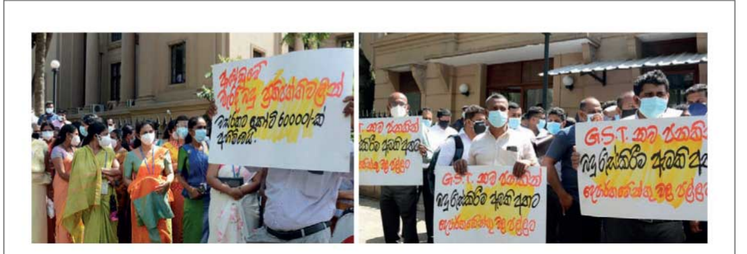
ஆரணங்குதால் அறிமுகப்படுத்தப்பட்டுள்ள புதிய பொருட்கள் மற்றும் சேவை வரிக்கு எதிராக உள்நாட்டு இறைவறி திணைக்கள ஊழியர்கள் நேற்று (18) நிதியமைச்சுக்கு முன்பாக ஆர்ப்பாட்டத்தில் ஈடுபட்டனர்.