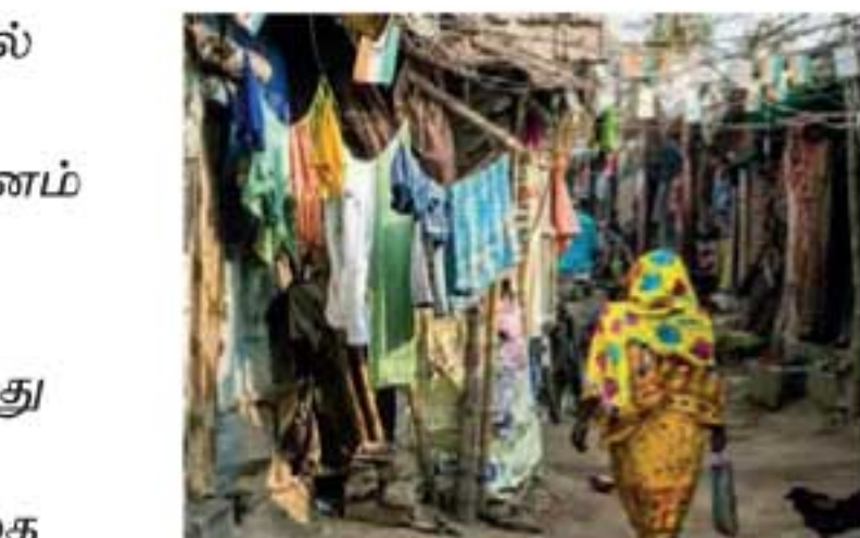
உயர்ந்து 142ஆக அதிகரித்துள்ளது. அதேசமயம் ஏழைகளின் எண்ணிக்கையும் இரு மடங்காக உயர்ந்துள்ளது.

உள்ள டர்வோஸ் நகரில் உலகப் பொருளாதார மாநாடு நேற்று முன்தினம் (17) ஆரம்பமானது. இந்த மாநாட்டில் இந்தியாவில் அதிகரித்து வரும் சமத்துவமற்ற சமூகம் குறித்த அறிக்கை வெளியிடப்பட்டுள்ளது. கொரோனா காலத்தில் இந்தியாவில் கோடீஸ்வர்கள் எண்ணிக்கை 39 சதவீதம்