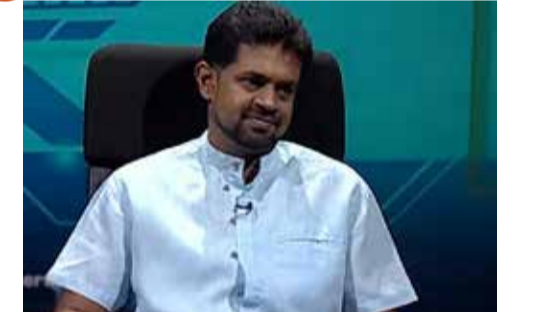
அது பலனில்லை என அவர் மேலும் தெரிவித்துள்ளார்.

இது தொடர்பாக சம்பந்தப்பட்ட அமைச்சரை தொடர்பு கொள்ள முயற்சித்த போதும்