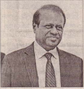
(கொழும்பு) பதவி நீக்கம் செய்யப்பட்ட இராஜாங்க அமைச்சர் சுசில்

பிரேமஜயந்தவின் கீழ் இருந்த விடயங்கள் மற்றும் நிறுவனங்கள் கல்வி அமைச்சர் திணைக் குணவர்தனவின் கீழ் கொண்டு வரப்பட்டுள்ளன.