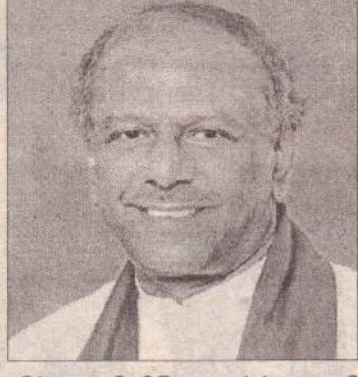
யிட்ட அதிவிசேட வர்த்தமானி அறிவித்தலிலேயே இந்த விடயம் வெளிப்பட்டுள்ளது. (நி-5)

10 அமைச்சுக்களின் விடய தானங்களை திருத்தியமைத்து ஜனாதிபதி கோட்டாபய ராஜபக்ஷ நேற்று முன்தினம் வெளி