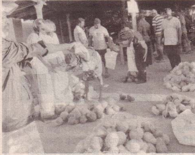
எருக்குக் கிடைப்பதில்லை. எனவே கரைச்சி பிரதேச சபை தலையீடு செய்து உரிய நடவடிக்கை எடுக்க வேண்டுமென்று தேங்காய் உற்பத்தியாளர்கள் கோரிக்கை விடுத்துள்ளனர். (ஒ-4-113)

கிளிநொச்சி பொதுச் சந்தைக்குக் கொண்டுசெல்லப்படும் தேங்காய்கள், ஏலத்துக்கு விடப்படுகின்றன. எனினும் ஏலத்தில் தீர்மானிக்கப்படும் பணம் உற்பத்தியாளர்கள்