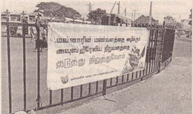
(மன்னார்) மன்னார் மாவட்டத்தில் உள்ள கரையோரப் பகுதிகளில் இடம்பெறும் சட்டவிரோத கனியவள அகழ்வு மற்றும் ஆய்வுகளை உடனடியாக நிறு

த்தக் கோரி மன்னாரின் சுற்றாடலை பாதுகாக்கும் அமைப்பின் ஒழுங்கமைப்பில் பொது இடங்களில் விழிப்புணர்வு ஏற்படுத்தும் பதாகைகள் காட்சிப்படுத்தப்பட்டுள்ளன. மன்னார் கடற்கரையோரங்களில் காணப்படும் மணல்களில் மிகவும் விலை உயர்ந்த அரிதான தைத்தனியம் எனும் கனிமம் அதிகளவு காணப்படுகிறது. குறித்த தைத்தனியத்தை அகழ்வு செய்யும் பணிகள் சட்டவிரோதமாக இடம்பெறுவதை தடுக்கக் கோரி குறித்த விழிப்புணர்வு பதாகைகள் காட்சிப்படுத்தப்பட்டுள்ளன. (4-5-285)