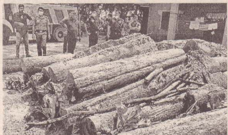
(தருமபுரம்) தருமபுரம் பொலிஸாருக்கு கிடைக்கப்பெற்ற தகவலுக்க