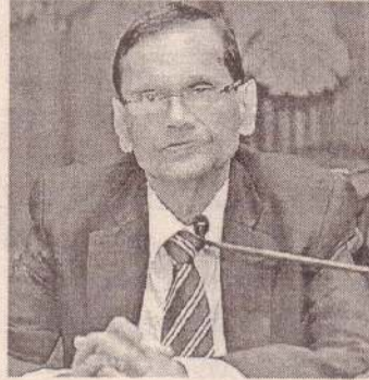
கருத்து ஆகியவற்றின் காரணமாக ஜப்பான் அதைச் செய்யத் தகுதி பெற்றுள்ளது என்றும் அவர் குறிப்பிட்டார். (நி-5)

(கொழும்பு) சர்வதேச ரீதியில் இலங்கை எதிர்நோக்கும் சில பிரச்சினைகளை தீர்க்க ஜப்பானின் உதவியை நாடவுள்ளதாக வெளிவிவகார அமைச்சர் பேராசிரியர் ஜி.எல்.பீரீஸ் தெரிவித்தார். இரு நாடுகளுக்கிடையிலான இராஜதந்திர உறவுகளின் 70 ஆவது ஆண்டு நிறைவை முன்னிட்டு ஜப்பானிய தூதரகத்துடன் கூட்டாக நடத்திய உட்கவியலாளர் சந்திப்பில் அவர் இதனைத் தெரிவித்தார். இலங்கையின் பார்வையை மற்ற நாடுகளுக்கு முன்வைப்பதிலும் விளக்கமளிப்பதிலும் ஜப்பான் ஏற்கனவே அதன் பங்கை ஆற்றியுள்ளதாக அமைச்சர் தெரிவித்தார். ஜப்பானிய கலாசாரம் காட்டும் பச்சாதாபம், இரக்கம், மென்மை மற்றும் ஒருமித்த