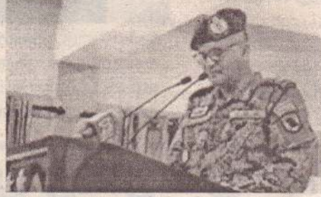
கும் நடவடிக்கைகள் முன்னெடுக்கப்பட்டு வருகின்றது.

ஏற்கனவே இராணுவம் மற்றும் சுகாதாரப் பிரிவினரால் மூன்றாம் கட்ட தடுப்பூசி யாழ்ப்பாண மாவட்டம் முழுவதிலும் பரவலாக பொதுமக்களுக்கு வழங்