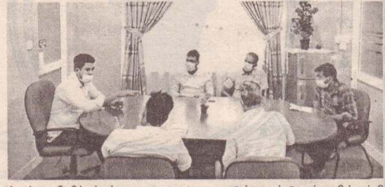
க்கம் தெரிவிக்கப்பட்டது. அத்துடன் கொக்குவில் சந்தி மற்றும் கல்வியங்காட்டுச் சந்தி ஆகிய சந்திகளில் வீதிச் சமிக் கைகள் இடும் நோக்குடன் அந்த இடங்களைச் சுற்றியுள்ள பகுதிகளை அகலிப்புச் செய்யவும் இணக்கம் தெரிவிக்கப்பட்டுள்ளது. (4-5-18)