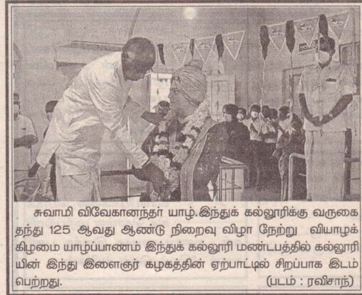
சுவாமி விவேகானந்தர் யாழ்.இந்துக் கல்லூரிக்கு வருகை தந்து 125 ஆவது ஆண்டு நிறைவு விழா நேற்று வியாழக் கிழமை யாழ்ப்பாணம் இந்துக் கல்லூரி மண்டபத்தில் கல்லூரியின் இந்து இளைஞர் கழகத்தின் ஏற்பாட்டில் சிறப்பாக இடம் பெற்றது.

சேவைகள் பணியாளர் ஆ.கேதிஸ்வரன் அறிவித்துள்ளார். இந்நிகழ்வானது "ஐக்கியமாக - ஒரேமனதுடன்-வலுவாக" என்ற தொனிப் பொருளில் நாடளாவிய ரீதியில் உள்ள அனைத்து மாகாண மற்றும் மாவட்ட சுகாதார திணைக்களங்கள், சுகாதார மருத்துவ அதிகாரி காரியாலயங்கள், பிரதேச, ஆதார, மாவட்ட பொது மற்றும் போதனா மருத்துவமனைகளில் நடைபெற உள்ளது என அவர் மேலும் தெரிவித்தார். (4-5)