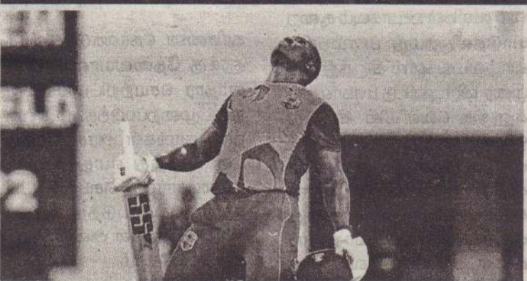
இங்கிலாந்து அணிக் கெதிரான மூன்றாவது இரு