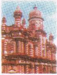
Second Cross Street Entrance