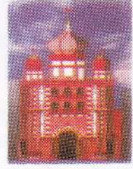
Main Street Entrance

காத்தான்குடி ஜாமிஅதுல் பலாஹ் அறபுக்கல்லூரியில் பட்டம் பெற்று வெளியாகிய மௌலவி, ஹாபிழ்களின் அமைப்பான மஜ்லிஸ்ல் பலாஹிய்யின் (பழைய மாணவர் அமைப்பு) ஏற்பாட்டில் வெளியிடப்படும் 'வைகுல் பலாஹ் சரிதை' எனும் நூலிற்கு வாழ்த்துரை வழங்கக் கிடைத்ததையிட்டு எமது பள்ளியவாயல் நிருவாகம் மட்டட்ட மகிழ்ச்சியடைகின்றது.