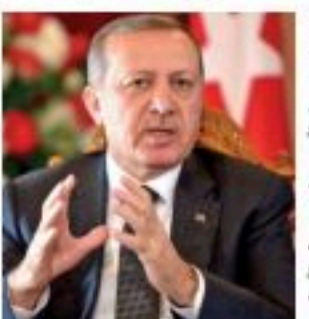
அறிவித்தார் என்பது குறிப்பிடத்தக்கது.

துருக்கி ஜனாதிபதி அர்துர்கான் தெரிவிப்பு தீவிரவாதத்துக்கு கட்டார் உதவுகிறது என்பதற்கு எந்த ஆதாரமும் இல்லை என்று துருக்கி ஜனாதிபதி அர்துர்கான் தெரிவித்துள்ளார். இதுகுறித்து அர்துர்கான் தெரிவிக்கையில்:- "தீவிரவாதத்துக்கு கட்டார் உதவுவதாக இதுவரை நான் அறிந்ததில்லை. சவுதி மற்றும் அதன் கூட்டு நாடுகள் கட்டார் மீது சுமத்தியுள்ள குற்றச்சாட்டுக்கு எந்த ஆதாரமும் இல்லை" என்றார்.