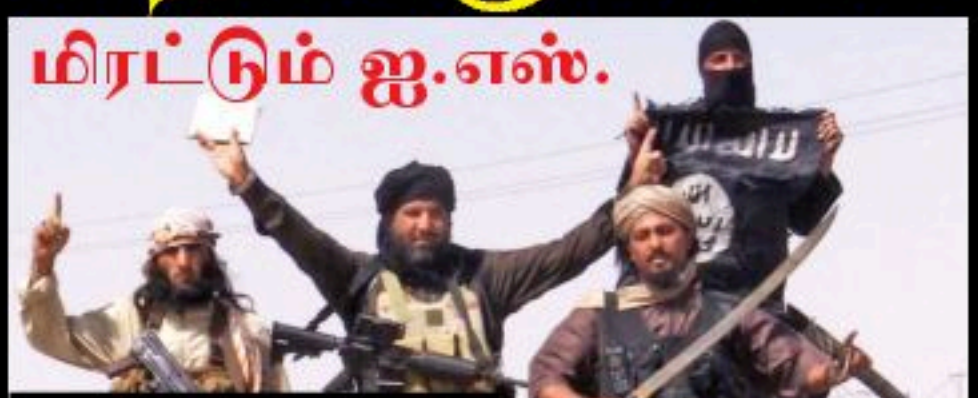
மிரட்டும் ஐ.எஸ். ஈரானைத் தொடர்ந்து சவுதியில் தாக்குதல் நடத்தப்போவதாக ஐ.எஸ். தீவிரவாத அமைப்பு மிரட்டல் விடுத்தது.

ஈரானைத் தொடர்ந்து சவுதி அரேபியாவில் தாக்குதல் நடத்தப்போவதாக ஐ.எஸ். தீவிரவாத அமைப்பு மிரட்டல் விடுத்தது. ஈரானைத் தொடர்ந்து சவுதியில் தாக்குதல் நடத்தப்போவதாக ஐ.எஸ். தீவிரவாத அமைப்பு மிரட்டல் விடுத்தது. ஈரானைத் தொடர்ந்து சவுதியில் தாக்குதல் நடத்தப்போவதாக ஐ.எஸ். தீவிரவாத அமைப்பு மிரட்டல் விடுத்தது. ஈரானைத் தொடர்ந்து சவுதியில் தாக்குதல் நடத்தப்போவதாக ஐ.எஸ். தீவிரவாத அமைப்பு மிரட்டல் விடுத்தது.