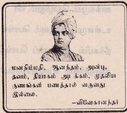
மணநிம்மதி, ஆவத்தம், அன்பு, தவம், தியாகம் அடிக்கம், முதலிய குணங்கள் பணத்தால் வகுவது இல்லை.

கீயக்கம் ஆவத்தம் 2 வது சந்தியாத்தியத்திற் நினைவுடன் ஐந்தியாழில் புரிகிறது. சச்சிகாவத்த சுத்த சக்தியாய் விளங்கும் தருவானே. 2 வகுடன் அன்லன் விவையாடுக.