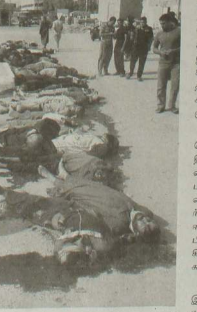
குறிப்பாக, பலூஜாவில் பொதுமக்கள் மீது துப்பாக்கிப் பிரயோகம் நடத்தப்பட்டதனால் 49 சுன்னி முஸ்லிம்கள் உயிரிழந்துள்ளதோடு 643 பேர் காணாமல்

தாயிஷ் பயங்கரவாதிகளை அழித்தொழிக்கின்றோம் என்ற பெயரில் அன்பார் மாகாணத்தில் ஊடுருவியுள்ள ஈராக்கின் ஷீஆ அரசு படையினர் அங்கு பொதுமக்கள் மீது சமூகநாயக துப்பாக்கிச் சூடு நடத்தியுள்ளதாக தெரிவிக்கப்படுகின்றது.