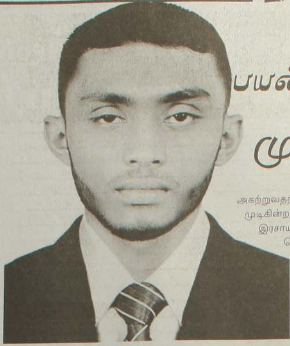
அகற்றுவதற்கும் இலகுவாக முடிகின்றது. பயிர்களுக்கு இரசாயன பதார்த்தங்களைத் தெளிக்கும்போது விவசாயிகள் பல போது ஒவ்வாமை களுக்கு உள்ளாகின்றனர். அவ்வாறான துரிதவிட மாண நிலைகளில் இருந்தும்