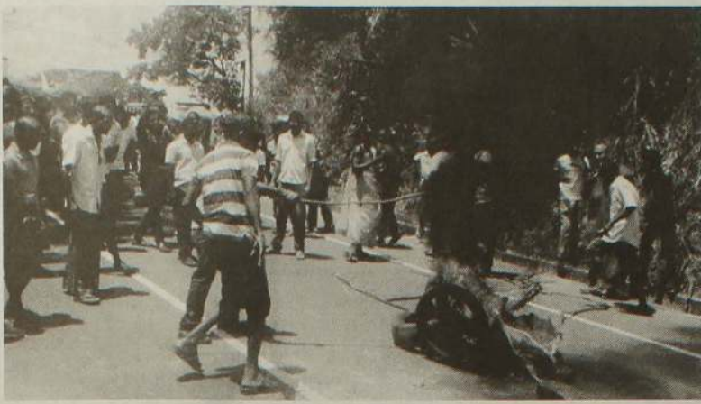
வதற்கு உடந்தையாக இருக்கும் வகையில் வழிநடத்தப்பட்டிருக்கிறார்கள் என்பதனை மேலும் பல விடயங்கள் உறுதிப்படுத்துகின்றன.

இது பொலிசாரின் அசமந்தப் போக்கல்ல. அரசாங்கத்தின் கட்டுப்பாட்டில் உள்ள இவர்கள் தாக்குதல்கள் நடந்து