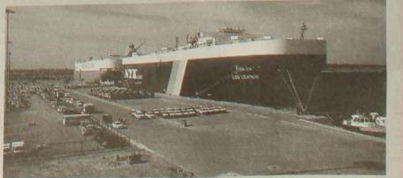
நீடித்த கலந்தாலோசனைகளையும், இணைந்த பங்களிப்புக்களையும், நன்மைகளைப் பகிர்ந்து கொள்வதையும் மக்களுக்கு பயன்களை வழங்குவதையும் பின்தொடர முடியும் எனவும் அவர் தெரிவித்தார்.

அம்பாந்தோட்டை துறைமுகத்தை இராணுவக் கண்ணோட்டத்துடனோ மூலோபாயப் பார்வையுடனோ யாரும் நோக்கத் தேவையில்லை என அரசாங்கம் அறிவித்துள்ளது. இரு தரப்புக்கும் இடையிலான புரிந்துணர்வின் அடிப்படையிலும் நன்மைகளின் அடிப்படையிலும் அம்பாந்தோட்டை துறைமுகத் திட்டம் நடைபெறுகிறது. அது உள்நாட்டில் சமூகப் பொருளாதார அபிவிருத்திக்கு பெரும் பங்களிக்கும். இந்தத் திட்டத்தை எப்படியும் நடைமுறைப்படுத்துவதற்கு இரு தர்ப்பும் உறுதியாக நாடியுள்ளோம் என சீன வெளிவிவகார அமைச்சின் பேச்சாளர் ஹுவா கன்யிங் தெரிவித்தார்.