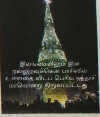
இலங்கையிலும் இன நல்லுறவுக்கென பாரிஸில் உள்ளதை விடப் பெரிய நத்தார் மரமொன்று நிறுவப்பட்டது.