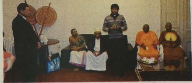
இம்முறை நத்தார் தினத்தை முன்னிட்டு இனங்களுக்கு இடையில் நல்லினக்கத்தை நாடி பாரிஸில் உள்ள இலங்கைத் தூதரகம் சர்வமத நிகழ்வொன்றை ஏற்பாடு செய்திருந்தது.

பொதியை முன்வைப்பதற்கு இது காலவரைதவறியுள்ளன. அரசியலமைப்புப் பேரவையாக மாற்றப்பட்டுள்ள பாராளுமன்றமே புதிய அரசியலமைப்பு தொடர்பாக விவாதிக்கவிருக்கிறது. இந்த நிலையில் முஸ்லிம் சமூகத்தினைப் பிரதிநிதித்துவப்படுத்துகின்ற முஸ்லிம் பாராளுமன்ற உறுப்பினர்கள் (பக்.14)