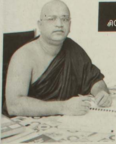
கலாநிதி பின்னவல் சங்கசுமண தேர் சிரேஷ்ட விசிவரையாளர், சிறி ஜயவர்தனபுர பல்கலைக்கழகம்

அண்மைக் காலமாக இலங்கையின் சமூக, பொருளாதார, அரசியல் பின்னணியில் உருவாகி வரும் பிரச்சினைகளின் முக்கியமான அடையாளங்களாக இன, மத ரீதியான கருத்துக்கள் கூர்மையடைந்து வருவதை எம்மால் அவதானிக்க முடிகின்றது.