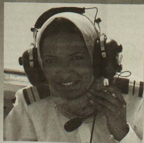
அனுமதிக்கப்படாத பெண்கள், இந்நாட்டில் வானத்தில் விமானம் ஓட்டுவதற்கு அனுமதிக்கப்பட்டிருப்பது மிகப் பெரும் முரண்பாடு எனக் கட்டிக்காட்டியுள்ளன.

ஆனால், தலாலின் இந்நடவடிக்கை குறித்து கருத்து வெளியிட்டுள்ள உட்கர்கள், பூமியில் கார் ஓட்டுவதற்கு