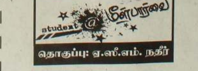
தொகுப்பு: ஏ.எஸ்.எம். நகீர்

இங்கே இலக்குகளை வகுத்து அவற்றை அடைவதற்காகப் பயணம் மேற்கொள்ள 10 வழிகளைக் கூறுகிறேன். நிச்சயம் உங்களுக்கு அவை வழிகாட்டும் என்பது எனது நம்பிக்கை.