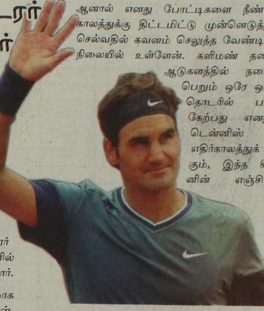
ஆனால் எனது போட்டிகளை நண்ட காலத்துக்கு திட்டமிட்டு முன்னெடுத்து செல்வதில் கவனம் செலுத்த வேண்டிய நிலையில் உள்ளேன். கனிமன் தரை ஆடுகளத்தில் நடைபெறும் ஒரே ஒரு தொடரில் பங்கேற்பது எனது டென்னிஸ் எதிர்காலத்துக்கும், இந்த சீசனின் எஞ்சிய

இது தொடர்பாக ரோஜர் பெடரர் தனது முகநூலில், "கடந்த ஒரு மாதமாக களத்திலும், களத்துக்கு வெளியேயும் கடினமாக உழைத்து வருகிறேன். இந்த ஆண்டின் தொடக்கம் எனக்கு வியக்கத்தக்க வகையில் அமைந்தது.