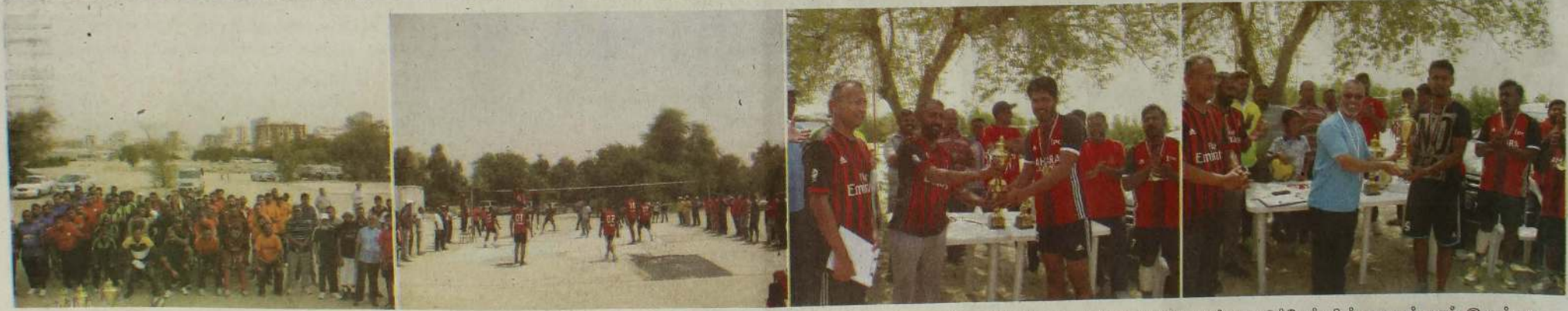
இக்ரக இஸ்லாமிய சங்கத்தின் 25 ஆவது ஆண்டு நிறைவை முன்னிட்டு ஏற்பாடு செய்திருந்த "Volleyball" சற்றிப் போட்டி அணிகளில் மிகவும் சிறப்பாக நடந்து முடிந்தது. இப்போட்டியில் குகவத் வாழ் இலங்கை முஸ்லிம்களது 16 காய்ந்தாட்டக் குழுக்கள் கலந்து கொண்டன. வேலைப்பளுக்களுடன் இங்கு வாழ்ந்து கொண்டிருக்கும் பலருக்கும் விடுமுறை நாட்களை இவ்வாறு சந்தோசமாகக் களிக்கவும் இன்னும் மார்க் வழிகாட்டல்களையும் இக்ரக இஸ்லாமிய சங்கம் கடந்த 25 வருடங்களாக குகவத் நாட்டில் செய்து கொண்டு வருகிறது.

இலங்கை கிரிக்கெட் அணிக்கு தென் ஆபிரிக்காவின் முன்னாள் வேகப்பந்து வீச்சாளர் அலன் டொனால்ட் தற்காலிக பயிற்சியாளராக நியமிக்கப்பட்டுள்ளார். இலங்கை கிரிக்கெட் அணி இங்கிலாந்தில் நடைபெறும் சம்பியன்ஸ் கிண்ணத் தொடரில் பங்கேற்று விளையாடவுள்ளது. அந்தத் தொடருக்கான தற்காலிக பயிற்சியாளராக தென் ஆபிரிக்காவின் முன்னாள் ஜாம்பவான் அலன் டொனால்ட் நியமிக்கப்பட்டுள்ளார். இரண்டு மாதங்களுக்கு மட்டுமே இவர் பயிற்சியாளராக செயற்படுவார் என இலங்கை கிரிக்கெட் சபை அறிவித்துள்ளது. எதிர்வரும் 9ஆம் திகதியிலிருந்து பல்வேகல சர்வதேச மைதானத்தில் தொடங்கும் சிறப்புப் பயிற்சியில் டொனால்ட் கலந்து கொள்ளவுள்ளார்.