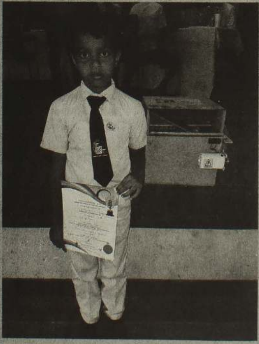
சுமார் 5 - 6 வீடுகளுக்கு ஒரு இயந்திரம் என்ற ரீதியில் இதனை பயன்படுத்த முடியுமாக இருக்கும். இவ்வியந்திரத்துக்காக அவருக்கு ரூபா. 1800 மட்டுமே செலவாகியதாம்.

தையல் இயந்திர தொழினுட்பத்திற்கு ஒப்பாக, ஒரு முறை அழுத்தி திருகினால் இந்த இயந்திரத்திற்குள் இடப்படும் குப்பைகள், நறுக்கப்பட்டு வெளியேறும். இதனை பசுளையாக பயன்படுத்த முடியும் என்கின்றார் அம்ஹர்.