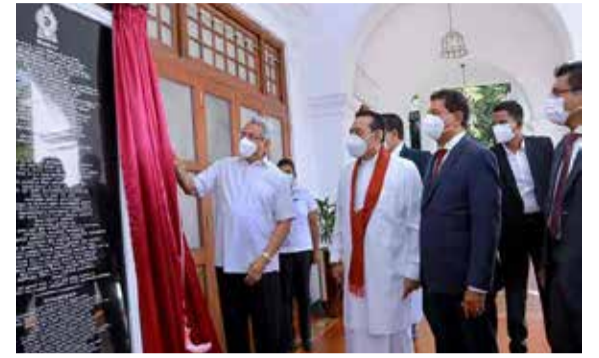
ஒரு குறிப்பையும் பதிவிட்டார்.

புனரமைக்கப்பட்ட பிரதமர் அலுவலகத்தின் திறப்பு விழாவைக் குறிக்கும் வகையில், முன்னாள் பிரதமர் களின் செயலாளர்களுடன் ஜனாதிபதி புகைப்படத்துக்கு தோற்றினார். பின்னர் அவர் நினைவுப் பதிவேட்டில்