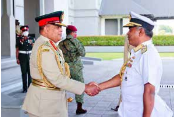
தால் மரியாதை ஏற்பதற்கான மேடைக்கு தளபதி அழைத்துச் செல்லப்பட்டார்.

அதனை அடுத்து கெட்டி எஃப்கே எதிரிவீரவின் தலைமையின் கீழ் வழங்கப்பட்ட அணிவகுப்பு மரியாதைக்கு மத்தியில் நிறைவேற்று பணிப்பாளர் நாயகத்