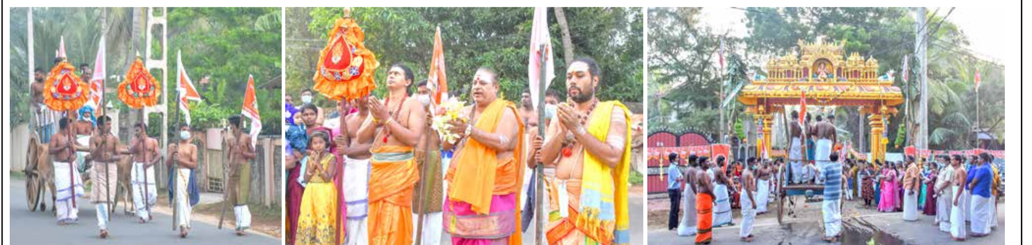
கல்வியங்காடு சந்திரசேகரப்பிள்ளையார் ஆலய மேற்குப்புற அலங்கார தோரண நுழைவாயில் திறப்பு விழா இறைமாட்சி வைபவமும் கலாசார மண்டப புகழ்விழாவும் கடந்த புதன்கிழமை இடம்பெற்றது.

சுட்டிக் காட்டியிருந்தோம். எனினும் இந்த விடயம் தொடர் பில் பெரிதாக ஒருவரும் கண்டு கொள்ளவில்லை. கட்டுநாயக்க விமான நிலை யத்துக்கு வரும் வெளிநாட்ட வர்கள் மற்றும் இலங்கையர்கள் சுகாதாரப் பாதுகாப்பை மீறி செயற்படுகின்றார்கள். முகக்க வசம் அணிவதில்லை. அத்து டன் சுகாதார பரிசோதகர்க ளுக்கு ஔவு பெற அறையில் லாத நிலைமை ஒன்று காணப் படுகின்றது. இவ்வாறான விடயங்கள் தொடர்பில் உரிய நடவடிக்கை கள் எடுக்கப்படவில்லை என்றால் கட்டுநாயக்க விமான நிலையத்தில் பணியாற்றும் சுகாதார பரிசோதகர்கள் அனை வரும் கடமையில் இருந்து விலகவேண்டிய நிலைமை ஏற் படும்-என்றார். (அ)