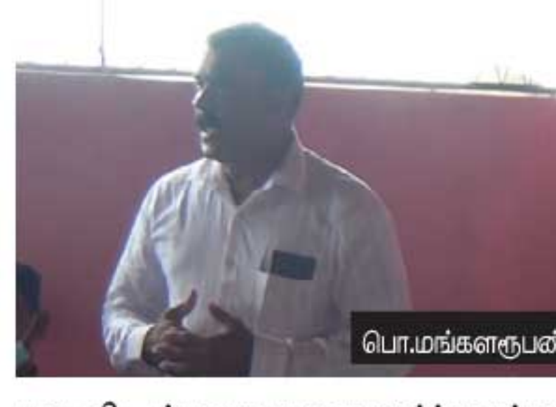
பல விடங்களை துறைசார்ந்தவர்கள் மேம்படுத்திக் கொடுக்க வேண்டிய தார்மீக பொறுப்பும் உள்ளது.