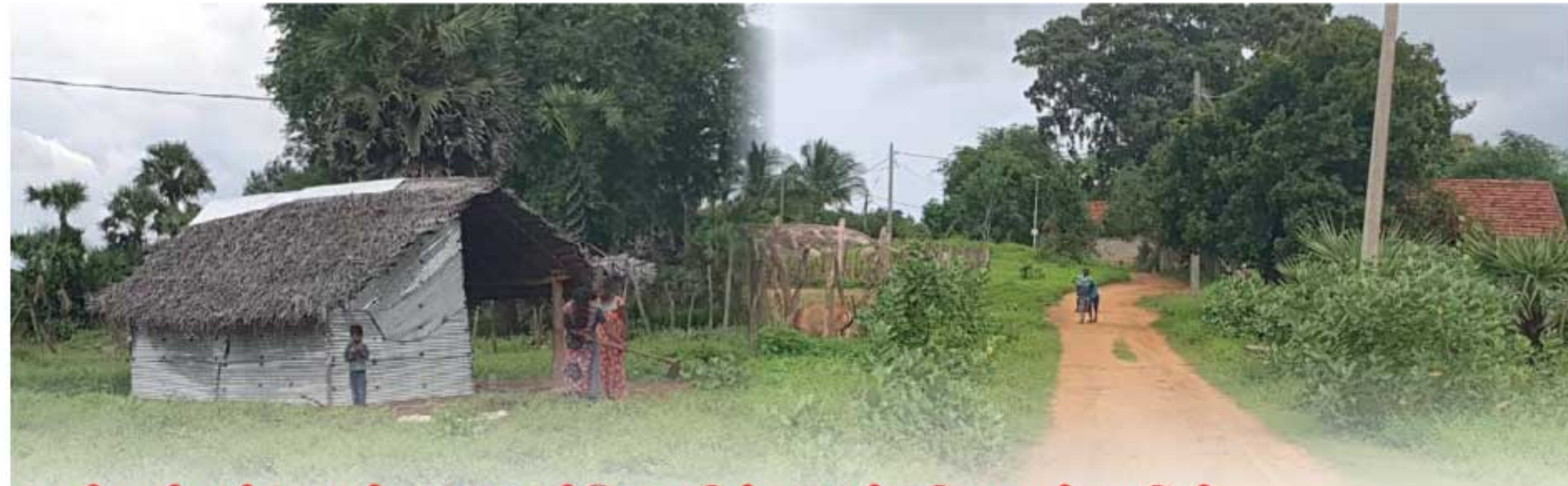
குஞ்சங்கற்குளம், மதுரங்கேணிக்குளம் கிராமங்களின்