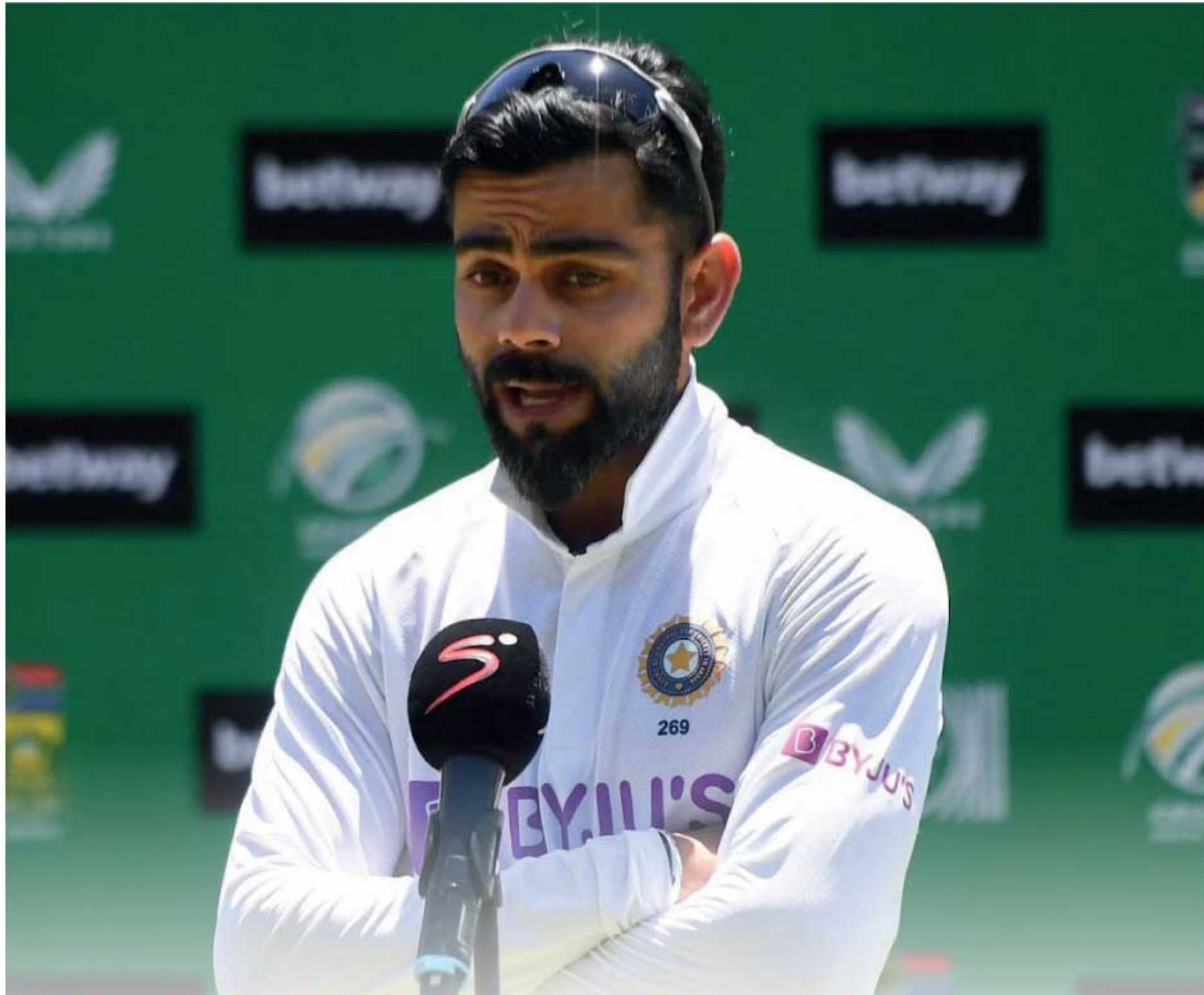
இந்திய கிரிக்கெட் அணியின் தலைமைப் பொறுப்பிலிருந்து