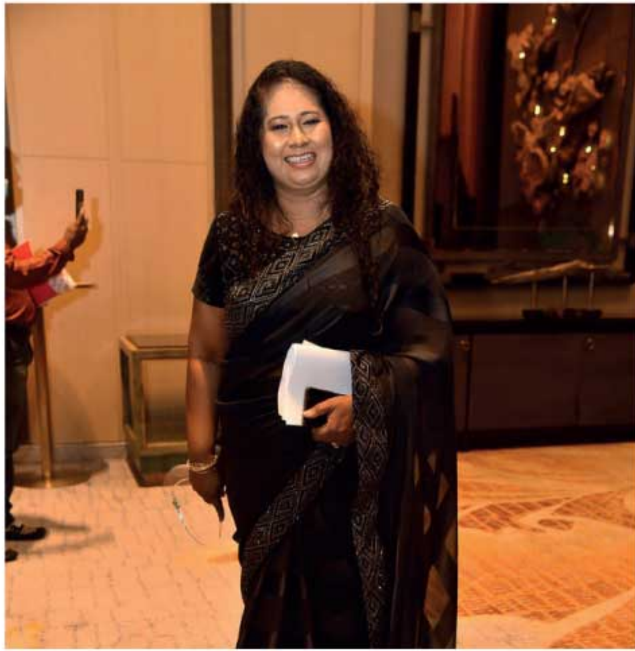
நிலைபேறான மற்றும் உள்ளடக்கமான பொருளாதார வளர்ச்சியில் தலைவர்களாக, ஊழியர்களாக, தொழில் முயற்சியாளர்களாக மற்றும் பங்களாளர்களாக ஆறும் பங்களிப்புகளை கௌரவித்து வெளிக் கொணரும் வகையில் சிறந்த 50 நிபுணத்துவ மற்றும் தொழில்நிலை பெண்கள் விருதுகள் அமைந்துள்ளது.

கடந்த காலங்களில் 470க்கும் அதிகமான வெற்றியாளர்களைக் கொண்டுள்ளதுடன், நாட்டின்