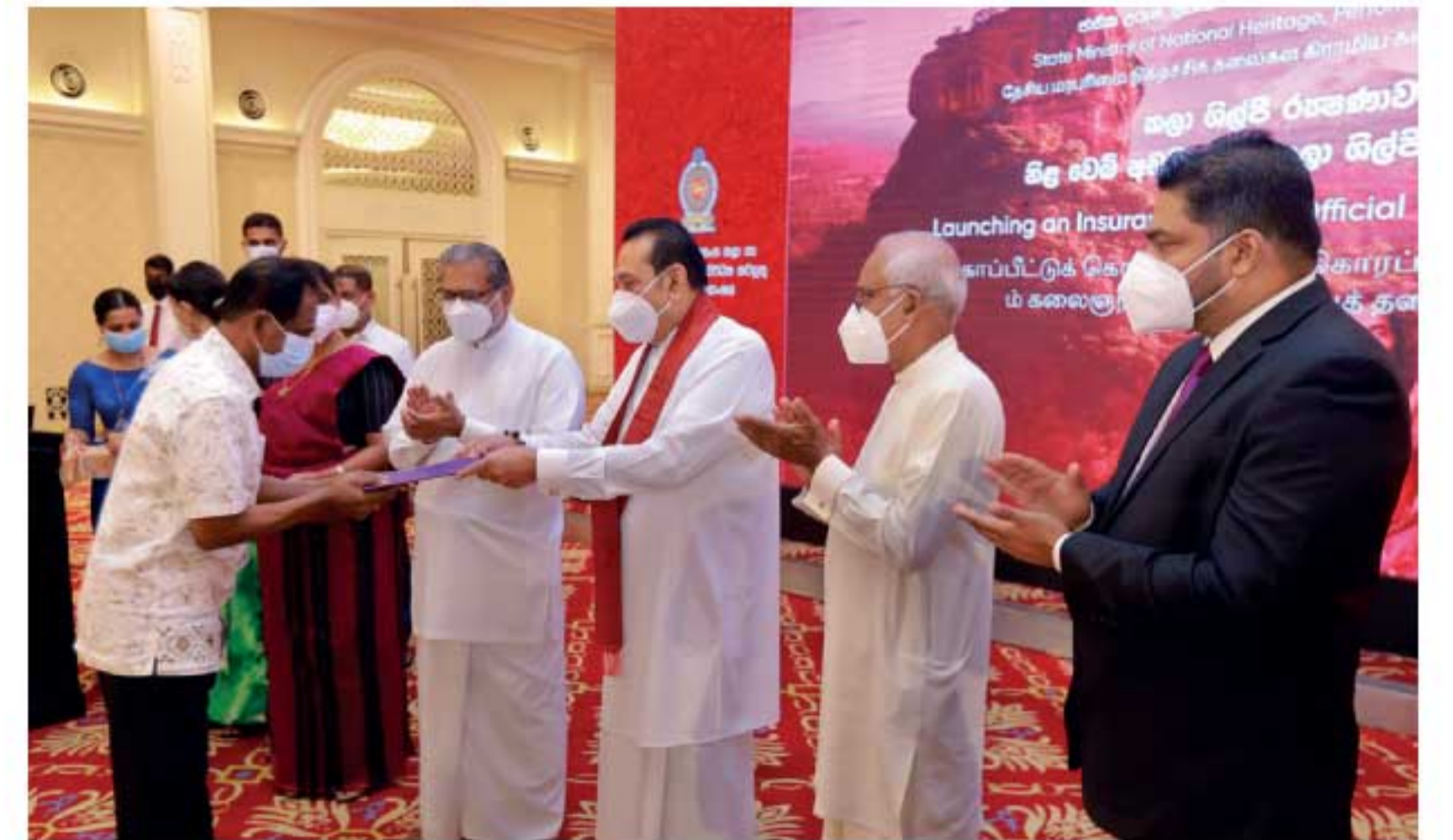
அந்நிகழ்வில் கலந்து கொண்டு இவ்வாறு குறிப்பிட்டார். உரையாற்றுகையிலேயே பிரதமர் தொடர்ச்சி P2

இலவசமாக வழங்கப்படும் மருத்துவ உதவி விபத்துக் காப்புறுதியானது கலைஞர்களுக்கு எம்மால் வழங்கக்கூடிய சிறந்த பரிசாகும் என பிரதமர் மஹிந்த ராஜபக்ஷ தெரிவித்தார். கலைஞர்களுக்கான காப்புறுதி பத்திரம் வழங்கல், தேசிய மரபுரிமைகள், அரங்குக் கலைகள் மற்றும் கிராமியக் கலைகள் மேம்பாட்டு இராஜாங்க அமைச்சின் www.heritage.gov.lk உத்தியோகப்பூர்வ இணையத்தளம் மற்றும் கலைஞர்களுக்கான தரவுத்தளம் வெளியீட்டு விழா அலரி மாளிகையில் நேற்று முன்தினம் (20) நடைபெற்றது.