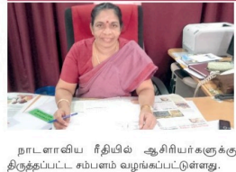
நாடாளிய ரீதியில் ஆசிரியர்களுக்கு திருத்தப்பட்ட சம்பள வழங்கப்பட்டுள்ளது.