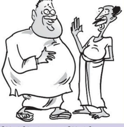
எதிர்க்கட்சிக்குள்ள ஒரு எதிர்க்கட்சியா...?