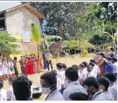
ஊடுபொய்க்கலை முன்னிட்டு புதுவை சார்வதி தேசிய கல்யாணியில் நேற்று (21) சிறப்பு விழாபொன்ற அறிவிப்பு திருவோக்கச்சார் தலைமையில் இடம்பெற்றது.