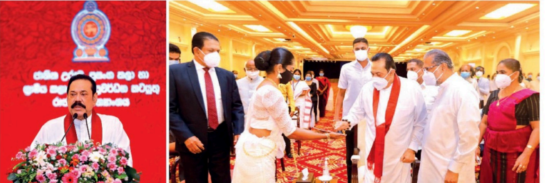
பிரதமர் மஹிந்த ராஜபக்ஷ அவர்கள் கலைஞர்களுக்கான காப்புறுதிப் பத்திரம் வழங்கும் நிஷ்வியை கைவிட்டுள்ளார்.

யுத்தத்தின் ஆக்கப்பூர்வமாக மக்களிடம் கொண்டு செல்வ கலைஞர்கள் பெரும் முயற்சி செய்திருக்கிறார்கள். அந்த முயற்சியை மக்கள் இன்னும் இசைக்கிறார்கள். நம் நாட்டின் கலைஞர்கள் தங்கள் முழு வாழ்க்கையையும் தங்கள் கலைக்கான அர்ப்பணிப்புகளாகச் செய்துள்ளார்கள். அவர்கள் அணிபூர்வியும் துறையாக அதிகரிக்கிறார்கள்.