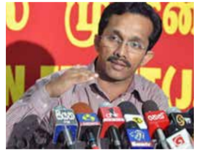
விட்டது என்பது தெளிவாகிறது எனவும் குறிப்பிட்டார்.

கொழும்பு, ஜன. 25 ஜனாதிபதியின் பதவிக்காலம் இரண்டு வருடங்கள் நீடிக்கப்படவேண்டும் என சில பாராளுமன்ற உறுப்பினர்கள் கூறுவதை சாதாரணமாக எடுத்துக்கொள்ளக்கூடாது என மக்கள் விடுதலை முன்னணி தெரிவித்துள்ளது.