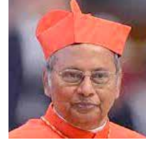
அதற்கு அர்த்தம் ஐக்கிய நாடுகள் சபைக்கு செல்வது என்றும் அவர் கூறினார். மேலும் இந்த வழக்கை முன்னெடுத்துச் செல்வதற்காக இலங்கையுடன் தொடர்பு வைத்திருக்கும் சக்திவாய்ந்த நாடுகளையும் தாம் அணுக வுள்ளதாக கொழும்பு பேராயர் குறிப்பிட்டார்.

கிடைக்க தங்களால் முடிந்தவரை முயற்சித்ததாகவும் இந்த முயற்சிகள் அனைத்தும் தோல்வியடைந்துவிட்டன என்றும் அவர் கூறினார். எனவே சர்வதேசத்துக்குச் செல்வதற்கான சாத்தியக்கூறுகளை ஆராய்வதாகவும்