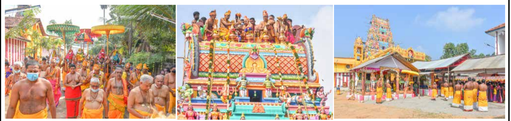
யாழ்ப்பாணம் நல்லூர் வடக்கு அருள்மிகு ஸ்ரீ சந்திரசேகரப் பிள்ளையார் ஆலயத்தின் மகாகும்பாபிஷேகமும், புதிதாக நிர்மாணிக்கப்பட்ட பஞ்சதள இராஜகோபுர கும்பாபிஷேகமும் நேற்று முன்தினம் காலை பக்தி பூர்வமாக இடம்பெற்றது.

யடிப் பகுதியிலுள்ள வர்த்தகர்கள், ஓட்டோச் சாரதிகள், அந்தப் பகுதியால் பயணத்தில் ஈடுபடும் மக்கள் என பலராலும் வழிபடப்பட்டு வந்த பிள்ளையார் சிலையே மாயமாகியுள்ளது. இனத்தெரியாத நபர்கள் குறித்த சிலையை அங்கிருந்து அகற்றியுள்ளனர் என தெரிவிக்கப்பட்டது. (அ)