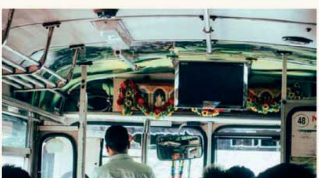
ஆசனங்களின் எண்ணிக்கைக்கு ஏற்ப பயணிகளை ஏற்றிச்செல்லும் விதி, பல பஸ்களில் மீறப்படுவதாக கூறினார். தொடர்ச்சி P2

நேற்று செய்தியாளர்களிடம் பேசிய அவர், கொரோனா வைரஸ் பரவல் காரணமாக அறிமுகப்படுத்தப்பட்ட