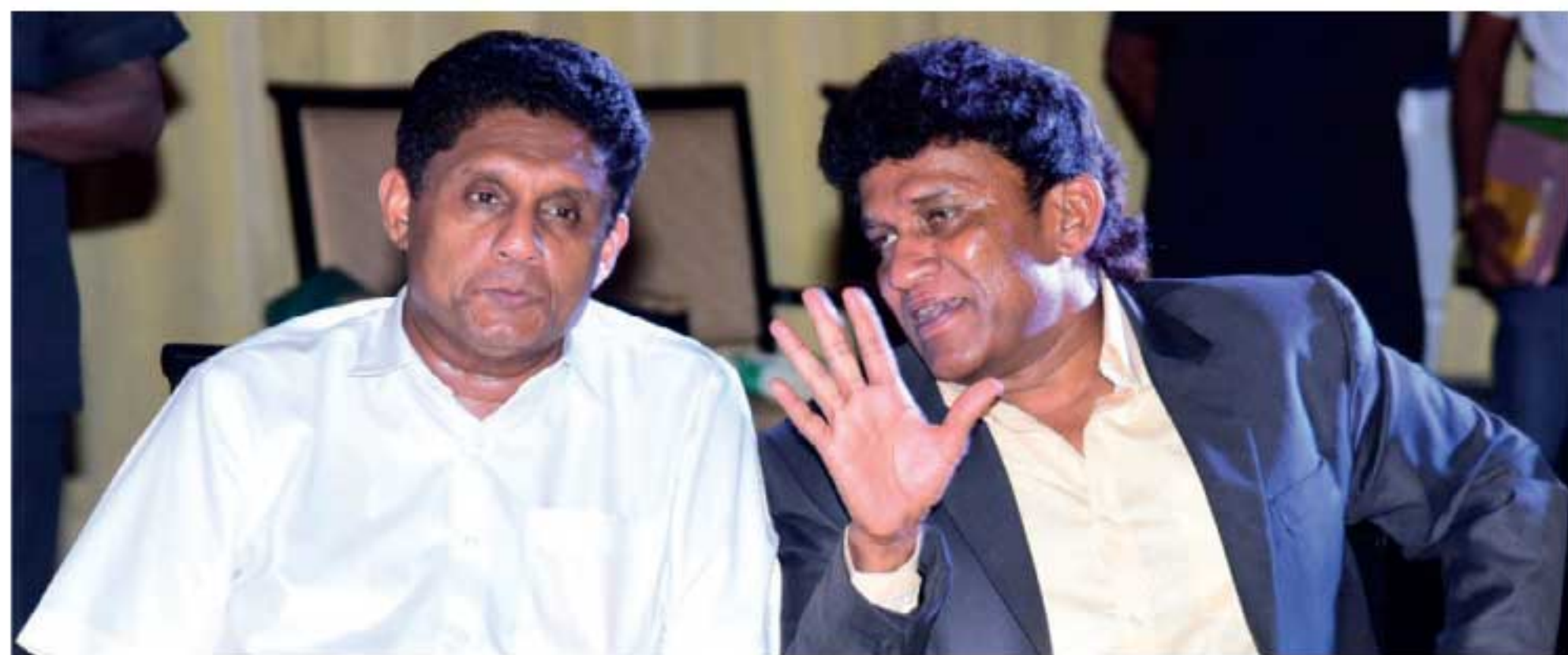
இவ்வாறு தெரிவித்தார். மனோ கணேசன் எம்.பி மேலும் கூறுகையில், "வழமையாக அரசாங்கங்கள் பதவிக்கு வரும். பின்னர் அது விழும். அதைவிட, புதிய அரசாங்கம் பதவிக்கு வரும். அதுவும் விழும். இன்னோர்

நாம் முன்னோக்கிச் சென்று, இந்தக் காட்டாட்சியை வீழ்த்த வேண்டும் எனத் தெரிவித்த தமிழ் முற்போக்குக் கூட்டணியின் தலைவரும் பாராளுமன்ற உறுப்பினருமான மனோ கணேசன், "அதற்கு சஜித் பிரேமதாஸும் சம்பிக்க ரணவக்கவும் முரண்பாடுகளை மறந்து கைகோர்க்க வேண்டும்" என்றார்.