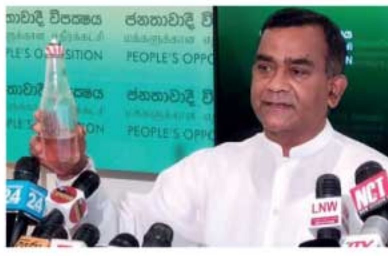
உள்ள எதிர்க்கட்சித் தலைவரின் அலுவலகத்தில் இந்த ஊடகவியலாளர் சந்திப்பு இடம்பெற்றது. தொடர்ச்சி P2

மின்வெட்டுக்கு எதிர்ப்புத் தெரிவிக்கும் வகையில், ஐக்கிய மக்கள் சக்தியின் தேசிய அமைப்பாளரும் பாராளுமன்ற உறுப்பினருமான திஸ்ஸ அத்தநாயக்க, கொழும்பில் நேற்று (24) இடம்பெற்ற ஊடகவியலாளர் சந்திப்புக்கு குப்பி விளக்குடன் வந்திருந்தார். கொழும்பு, மார்கன் பெர்னாண்டோ மாவட்டத்தில்