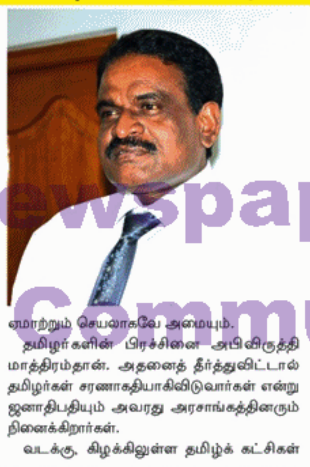
ஏமாற்றும் செயலாகவே அமையும். தமிழர்களின் பிரச்சினை அபிவிருத்தி மாத்திரம்தான். அதனைத் தீர்த்துவிட்டால் தமிழர்கள் சரணாகதியாகிவிடுவார்கள் என்று ஜனாதிபதியும் அவரது அரசாங்கத்தினரும் நினைக்கிறார்கள். வடக்கு, கிழக்கிலுள்ள தமிழ்க் கட்சிகள்

தலைவர்கள் நகர்த்தாலும் இனப்பிரச்சினை விடயத்தில் அக்கறையற்றவர்களாகவே இருக்கிறார்கள். மேலும் உள்நாட்டுப் பொறிமுறையால் இனப்பிரச்சினையைதீர்க்கும் ஆளுமை, சக்தி இவ்வகைத் தலைவர்களிடம் இல்லை என்பதை உணர முடிகிறது. இந்நிலையில், தமிழ்த் தலைவர்கள் உறுதியான முடிவுக்கு வர வேண்டும். எமது பிரச்சினைகளைத் தீர்ப்பதற்கு ஒரே வழிமுறை சர்வதேச அணுகுமுறைதான் என்பதை உணர்ந்து அதற்கேற்ப தமது அணுகுமுறைகளை வேகமாகவும் விவேகமாகவும் நகர்த்த வேண்டும். ஜனாதிபதி அழைப்பார், பேசுவார், தீர்ப்பார் என்றெல்லாம் நினைப்பது ஏமாற்று வேலையாகவே அமையும். எனவே, உள்நாட்டில் பிரச்சினையைத் தீர்ப்பதற்கு சிங்கள ஆட்சியாளர்களால் முடியாதென்பது மட்டும் தெளிவான உண்மையாகும். அப்படி இந்த சிங்களத் தலைவர்கள் அணுகுமுறையும் தமிழ் மக்களை மட்டும்மல்ல, சர்வதேசத்தையும்