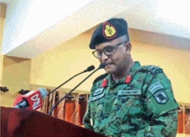
கப்படுகின்றன. அனைவரும் மூன்றாம் கட்ட பூஸ்டர் தடுப்பூசியினை பெற்றுக்கொள்ள வேண்டும் - என யாழ். மாவட்ட இராணுவ கட்டளைத் தளபதி தெரிவித்தார்.

(யாழ். செய்தியாளர்) யாழ்ப்பாணக் குடாநாட்டிலுள்ள அனைத்து மக்களும் மூன்றாம் கட்ட பூஸ்டர் தடுப்பூசியினை கட்டாயமாக பெற்றுக்கொள்ள வேண்டும் - என யாழ். மாவட்ட இராணுவ கட்டளைத் தளபதி தெரிவித்தார். தற்போது நாட்டில் கொரோனா பரவல் அதிகரிக்கின்ற நிலையில் மக்கள் அனைவரும் மூன்றாம் கட்ட தடுப்பூசியினை பெற்றுக் கொள்வதன் மூலம் தொற்றிலிருந்து தங்களைப் பாதுகாத்துக்கொள்ள முடியும். ஏற்கனவே இராணுவம் மற்றும் கசாதாரப் பிரிவினரால் மூன்றாம் கட்ட பூஸ்டர் தடுப்பூசி யாழ்ப்பாண மாவட்டம் முழுவதிலும் பரவலாக பொதுமக்களுக்கு வழங்கும் நடவடிக்கைகள் முன்னெடுக்கப்பட்டு வருகின்றன. அத்தோடு பொதுமக்களுக்கு மூன்றாம் கட்ட தடுப்பூசி வழங்குமாறு சகல உதவிகளும் இராணுவத்தினரால் முன்னெடுக்கப்படுகின்றன. எனவே, பொதுமக்கள் தயக்கமின்றி தமது பிரதேசத்தினை தொற்றிலிருந்து பாதுகாத்து கொள்ளவேண்டுமாயின் மூன்றாம் கட்ட தடுப்பூசியினை பெற்றுக்கொள்வதால் தங்களை தொற்றிலிருந்து பாதுகாத்துக்கொள்ள முடியும் எனத் தெரிவித்தார்.