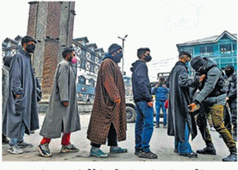
ஜம்மு - காஷ்மீரின் ஸ்ரீநகர் லால்ஷவுக் பகுதிக்கு வந்தவர்களிடம் பாதுகாப்புப் படையினர் திடீர் சோதனை நடத்தியபோது...

2 மாதங்களுக்கு முன்பு குந்தே டில்லி பொலிஸார், மற்ற பாதுகாப்பு அமைப்புகளுடன் ஒருங்கிணைந்து பயங்கரவாத எதிர்ப்பு நடவடிக்கைகளை தீவிரப்படுத்தியுள்ளனர். வாகனங்கள், ஹோட்டல்கள், தங்கும் விடுதிகளில் சோதனை நடத்தியதோடு, சந்தேகிக்கும் படியான நபர்களிடம் விசாரணை நடத்தி வருகின்றனர். அத்தோடு, ஆளில்லா ட்ரோன் விமானங்கள் மூலமும் கண்காணிக்கப்பட்டு வருகிறது. மொத்தமாக 200 குழுக்கள் குடியரசு தின பாதுகாப்பில் இடம்பெற்றுள்ளன.