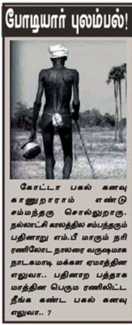
கோட்டா பகல் களவு காணுதாராம் என்று சம்மந்தரு சொல்லுறாக. நல்லாட்சி காலத்தில் சம்பந்தமும் பதினாறு எம்.பீ மாரும் நரி ரணிலோட நல்லரை வருஷமாக நாடகமாடி மக்கள் ஏமாத்தின எலுவா.. பதினாறு பத்தாக செயலான பெரும் ரணிலிட தீங்க கண்ட பகல் களவு ஜலுவா.. ?