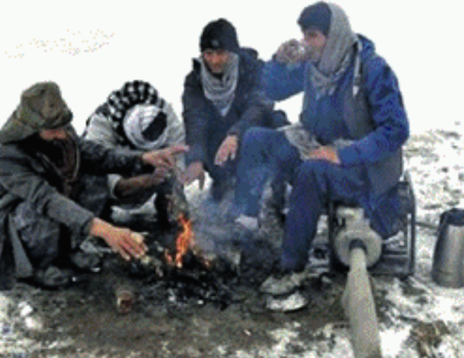
அவர்கள் கடுமையாக போராடி வருவதாக அந்நாட்டு போரிடர் மேலாண்மை அமைச்சு தெரிவித்துள்ளது.

ஆ ப்கானிஸ்தானில் கடும் பனிப்பொழிவால் 42 பேர் உயிரிழந்துள்ளதில் 76 பேர் காயமடைந்துள்ளதாக அந்நாட்டு தகவல்கள் தெரிவிக்கின்றன. ஆப்கானிஸ்தானின் 15 மாசானங்களில் கடுமையான பனிப்பொழிவு நிலவிவருகிறது. இதன் காரணமாக 42 பேர் உயிரிழந்துள்ளனர் மற்றும் 76 பேர் காயமடைந்துள்ளனர். மேலும், கடந்த 20 நாட்களில் நாடு முழுவதும் 2 ஆயிரத்துக்கும் மேற்பட்ட வீடுகள் இடிந்து வீழ்ந்துள்ளன. பாதிக்கப்பட்ட மக்களுக்கு அவசர உதவிகள் வழங்கப்பட்டு வருகின்றன. மேலும் பேரழிவுகளைத் தடுக்க