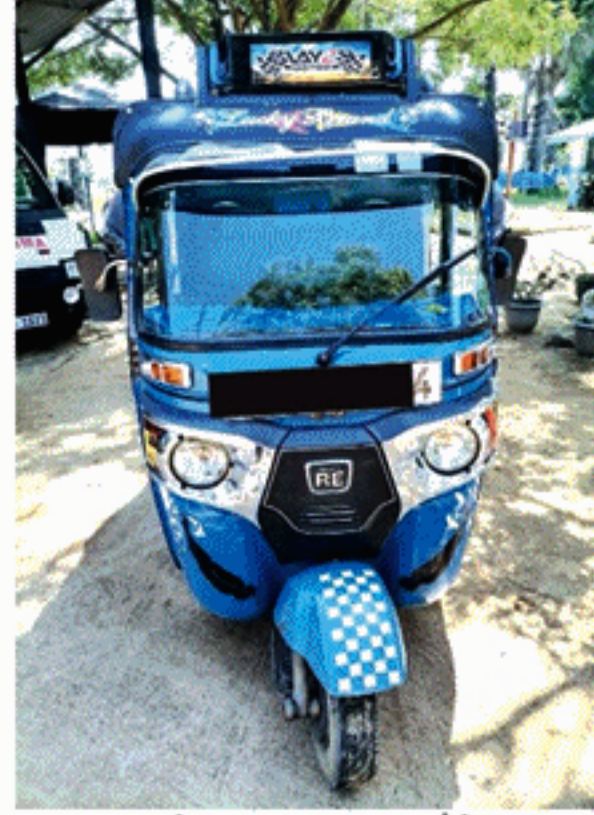
(கனகராசா சரவணன்) மட்டக்களப்பு ஆயித்திய மலை பிரதேசத்திலிருந்து மட்டக்களப்பு நகருக்கு வியாபாரத்துக்காக 8 கிலோ மாள் இறைச்சியை முச்சக்கரவண்டி ஒன்றில் எடுத்துச்சென்ற இருவரை வவுணைத்து பிரதேசத்தில் வைத்து நேற்று முன்தினம் (22) இரவு

கைதுசெய்துள்ளதாக வவுணைத்து பொலிஸ் நிலைய பொறுப்பதிகாரி நிசந்த அப்பஹாமி தெரிவித்தார். விசேட புலனாய்வுப் பிரிவினருக்குக் கிடைத்த தகவலொன்றினையடுத்து சம்பவ தினமான நேற்று முன்தினம் மாலை 6 மணியளவில் வவுணைத்து பொலிஸ் நிலைய குற்றத்தடுப்புப் பிரிவு பொறுப்பதிகாரி தலைமையிலான பொலிஸார் ஆயித்தியமலை வவுணைத்து வீதியில் கண்காணிப்பில் ஈடுபட்டுக்கொண்டிருந்தனர். இதன்போது மட்டக்களப்பு நகரை நோக்கி பிரயாணித்த முச்சக்கரவண்டியை நிறுத்தி சோதனையிட்டபோது அங்கு மறைத்துவைக்கப்பட்டிருந்த 8 கிலோ மாள் இறைச்சியுடன் இருவரை கைதுசெய்ததுடன், முச்சக்கரவண்டி ஒன்றையும் மீட்டுள்ளனர். இதில் கைதுசெய்யப்பட்டவர்கள் வவுணைத்து பிரதேசத்தைச் சேர்ந்த 26, 24 வயதுடையவர்கள் எனவும் ஆயித்திய மலை பிரதேசத்தில் இறைச்சியை வாங்கி மட்டக்களப்பு நகரில் விற்பனைசெய்துவருவதாகவும் பொலிஸாரின் ஆரம்பகட்ட விசாரணையில் தெரியவந்துள்ளதுடன், கைதுசெய்யப்பட்டவர்களை நீதிமன்றில் ஆஜர்படுத்த நடவடிக்கை எடுக்கப்பட்டுள்ளதாக பொலிஸார் தெரிவித்தனர்.