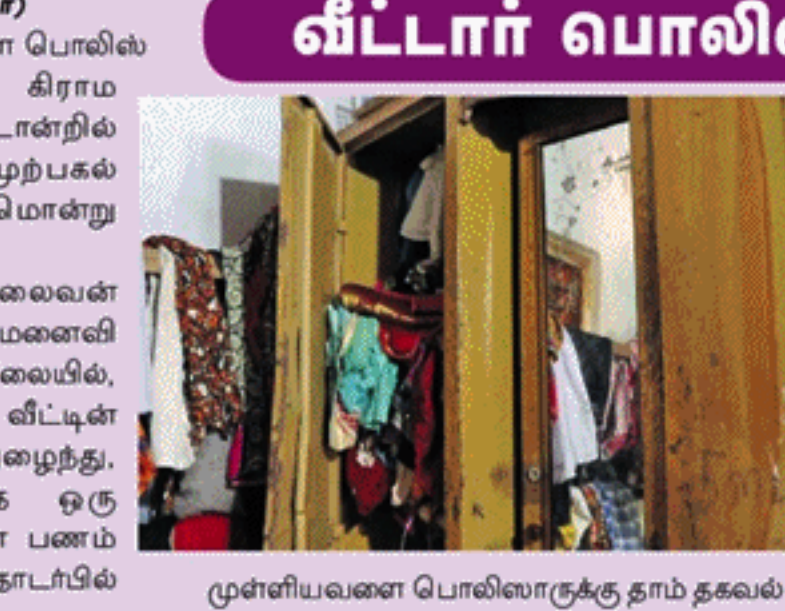
முள்ளியவளை பொலிஸாருக்கு தாம் தகவல்

(முல்லைத்தீவு திருபர்) முல்லைத்தீவு - முள்ளியவளை பொலிஸ் பிரிவிற்குட்பட்ட மாமூலை கிராம அலுவலர் பிரிவினரின் வீட்டொன்றில் கடந்த சனிக்கிழமை (22) முற்பகல் வேளையில் திருட்டுச்சம்பவமொன்று இடம்பெற்றுள்ளது. குறித்த வீட்டின் குடும்பத்தலைவன் கால்நடை வளர்ப்பிற்காகவும், மனைவி உறவினர் வீட்டிற்கும் சென்ற நிலையில், வீட்டில் எவருமில்லாத சமயம் வீட்டின் கூரையினைப் பிரித்து உள்ளுழைந்து, வீட்டு அலுவலர் பிரிவினரின் ஒரு இலட்சத்து 90 ஆயிரம் ரூபா பணம் திருடப்பட்டுள்ளதாகவும் இது தொடர்பில்