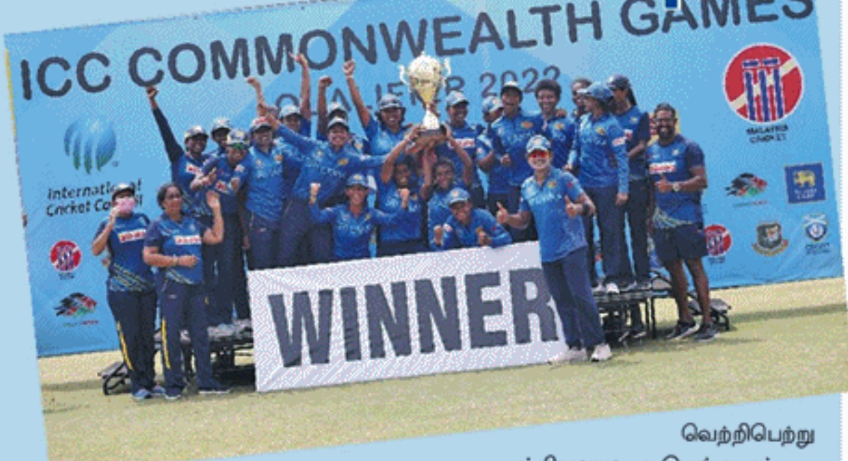
வெற்றிபெற்று சம்பியனானது. இதன்மூலம் இலங்கை மகளிர் கிரிக்கெட் அணி பேர்மிங்ஹாம் நடைபெறவுள்ள பொதுநலவாய விளையாட்டு விழாவுக்கு தகுதிபெற்றுள்ளது.

இங்கிலாந்தின் பேர்மிங்ஹாம் நடைபெறவுள்ள பொதுநலவாய விளையாட்டு விழாவின் மகளிர் கிரிக்கெட் போட்டிக்கு மலேசியாவில் நடைபெற்ற தகுதிகாண் போட்டியில் சம்பியனான இலங்கை மகளிர் கிரிக்கெட் அணி தெரிவாகியுள்ளது. முன்னதாக 7 அணிகள் பொதுநலவாய விளையாட்டு விழாவின் மகளிர் கிரிக்கெட் போட்டிக்கு தகுதிபெற்றிருந்த நிலையில், எஞ்சிய ஓர் அணியை தெரிவுசெய்வதற்காக மலேசியாவில் நடைபெற்ற தகுதிகாண் போட்டியில் இலங்கை, பங்களாதேஷ், மலேசியா, ஸ்கொட்லாந்து, கென்யா ஆகிய 5 அணிகள் பல்பரீட்சை நடத்தின. இதில் இலங்கை, பங்களாதேஷ் அணிகள் தலா 3 வெற்றிகளை பெற்றிருந்த நிலையில், இரு அணிகளும் இறுதி லீக் போட்டியில் நேற்று பல்பரீட்சை நடத்தின. இதில் 22 ஓட்டங்கள் வித்தியாசத்தில் வெற்றிபெற்ற இலங்கை மகளிர் அணி தாங்கள் விளையாடிய 4 போட்டிகளிலும்