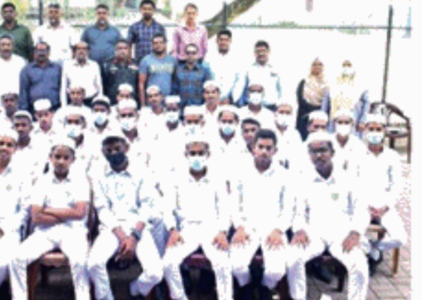
தேர்ந்தெடுக்கப்பட்ட சுமார் 70 பேருக்கு இந்த தலைமைத்துவ வழிகாட்டல் பயிற்சி வழங்கப்பட்டது.

அல்-ஹிக்மா கல்லூரியில் தமது 10, 11 மற்றும் ௧.பொ.த. உயர்தரத்தில் கல்வி கற்கும் மாணவ, மாணவிகளிலிருந்து மாணவத் தலைவர்களாக 2022ஆம் ஆண்டுக்காக புதிதாக