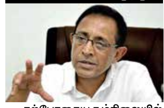
தற்போதைய சூழ்நிலையில் அரசு அதிகாரிகள்