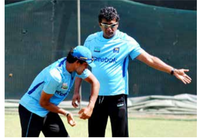
இரு அணிகளுக்கும் இடையிலான ஐந்து போட்டிகள் கொண்ட இருபது - 20 தொடர் எதிர்வரும் பெப்ரவரி 11 முதல் சிட்னி, கன்பெர்ரா மற்றும் மெல்பர்ன் மைதானங்களில் நடைபெறவுள்ளன. (ஐ)

இதனிடையே அவுஸ்திரேலிய சுற்றுப்பயணத்தில் பங்கேற்கும் 20 வீரர்களை கொண்ட இலங்கை அணி நேற்று அறிவிக்கப்பட்டது.