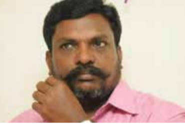
சந்தித்து பேசினார். சுமார் 30 நிமிடங்கள் நடந்த இந்த சந்திப்பில், நகர்ப்புற உள்ளூராட்சி தேர்தலுக்கான இட ஒதுக்கீடு குறித்து ஆலோசிக்கப்பட்டது. பின்னர், செய்தியாளர்களிடம் திருமாவளவன் கூறியதாவது: நகர்ப்புற உள்ளூராட்சி தேர்தல் தொடர்பாக அந்தந்த

சென்னை, ஜன. 31 நகர்ப்புற உள்ளூராட்சி தேர்தல் தொடர்பாக தி.மு.கவுடன் பேச்சுவார்த்தை சுமுகமாக நடந்து வருவதாக விசிக தலைவர் திருமாவளவன் தெரிவித்துள்ளார். நகர்ப்புற உள்ளூராட்சி தேர்தலில் வார்ட் பங்கீடு தொடர்பாக தி.மு.கவுடன் காங்கிரஸ், தமிழக வாழ்வுரிமைக் கட்சி சார்பில் பேச்சு நடத்தப்பட்டுள்ளது. அதன் தொடர்ச்சியாக, முதல்வரும், திமுக தலைவருமான ஸ்டாலின விடுதலை சிறுத்தைகள் கட்சித் தலைவர் திருமாவளவன் அண்ணா அறிவாலயத்தில்