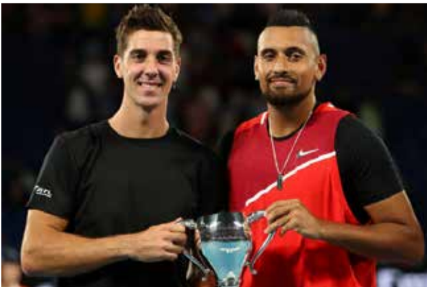
ஆஸி. ஓப்பன் ரென்னிஸ்:

இறுதியில் 25 ஓட்டங்களால் வெற்றி பெற்றது உலக ஜாம்பவான்கள் அணி. போட்டியின் ஆட்டநாயகனாக கோரி அண்டர்சனும், தொடரின் ஆட்டநாயகனாக மோர்ன் மோர்கலும் தெரிவானார்கள். (ஐ)