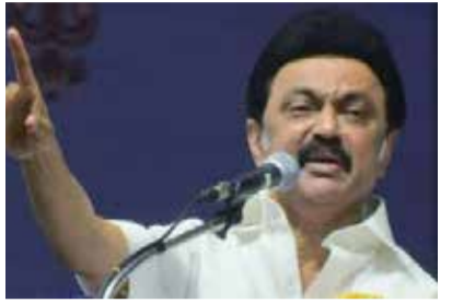
தார். அப்போது அமைச்சர்கள், எம்எல்ஏக்கள் உள்ளிட்ட முக்கிய நிர்வாகிகளின் குடும்ப உறுப்பினர்கள் தேர்தலில் போட்டியிவதை தவிர்க்க வேண்டும். இல்லாவிட்டால் வாக்காளர்களிடம் தவறான எண்ணத்தை உருவாக்கிவிடும் என முதலமைச்சர் உத்தரவிட்டிருக்கின்றார்.

தீவிரம் காட்டி வருகின்றனர். பல உணர்களில் மேயர், துணை மேயர், நகராட்சி, பேரூராட்சித் தலைவர், மண்டல தலைவர்கள் உட்பட முக்கிய பதவிகளைப் பிடிக்க கட்சி நிர்வாகிகள் தீவிர முயற்சியில் ஈடுபட்டிருந்தனர். இந்நிலையில் தி.மு.கவில் முக்கிய நிர்வாகிகளின் குடும்ப உறுப்பினர்கள் யாரும் தேர்தலில் போட்டியிட வேண்டாம் என்று முதல்வர் பிறப்பித்த உத்தரவு பல்வேறு மாற்றங்களை ஏற்படுத்தி வருவதாகக் கட்சியினர் தெரிவித்தனர். தி.மு.க. மாவட்டச் செயலாளர்களுடன் தேர்தல் பணிகள் குறித்து முதல்வர் காணொலி வாயிலாக ஆலோசனை செய்