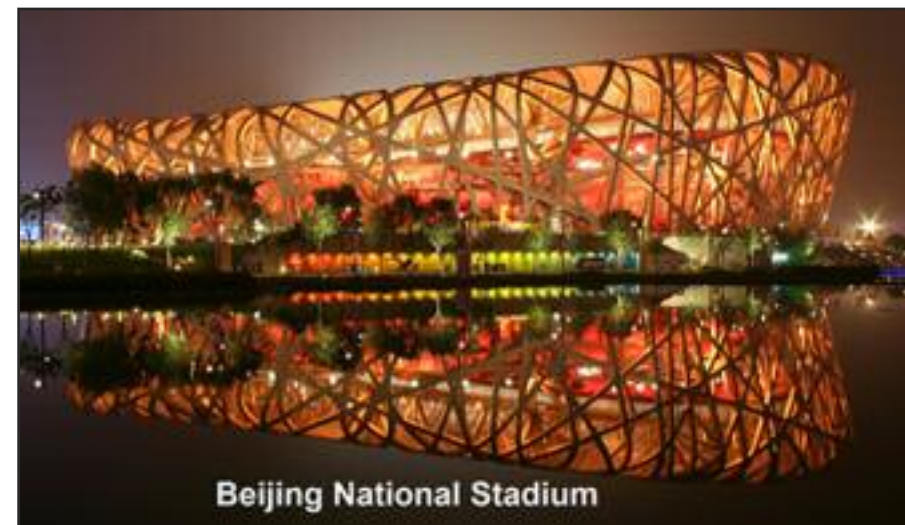
Beijing National Stadium

கோவிட்-19 தொற்று நோய்ப் பரவலைக் கட்டுப்படுத்தும் முகமாகப் பல சுகாதாரம் மற்றும் பாதுகாப்பு நெறிமுறைகள் 2022 குளிர்கால ஒலிம்பிக் விளையாட்டுப் போட்டியின்போது கடைப்பிடிக்கப்பட உள்ளன. இவ்விளையாட்டுக்களை நேரடியாகப் பார்க்க அனுமதிக்கப்பட உள்ள பொதுமக்களின் எண்ணிக்கை மிகவும் கட்டுப்பாட்டுக்குள் வைக்கப்பட்டுள்ளது. வெளிநாடுகளில் இருந்து வரும் பார்வையாளர் விளையாட்டுப் போட்டிகள் நடைபெறும் அரங்கில் அனுமதிக்கப்பட மாட்டார்கள். மட்டுப்படுத்தப்பட்ட உள்ளூர் பொதுமக்களுக்கு மட்டுமே விளையாட்டுப் போட்டிகள் நடைபெறும் அரங்கிற்குள்