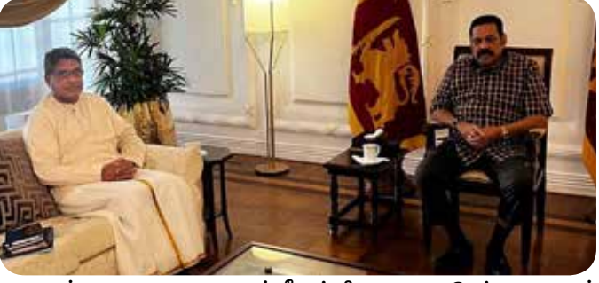
வடக்கு மாகாண ஆளுநர் ஜீவன் தியாகராஜா நேற்று கொழும்பில் பிரதமர் மஹிந்த ராஜபக்ஷவை மரியாதையின் நிமித்தம் சந்தித்தார். அப்போது எடுக்கப்பட்ட படம்.

இலங்கையில் மேலும் 19 பேர் கொரோனா வைரஸ் தொற்றால் மரணித்துள்ளனர். உயிரிழந்தவர்களில் 14 ஆண்களும், 5 பெண்களும் அடங்குகின்றனர். சுகாதார சேவைகள் பணிப்பாளர் நாயகத்தால் நேற்று முன்தினம் இந்த மரணங்கள் உறுதிப்படுத்தப்பட்டுள்ளன