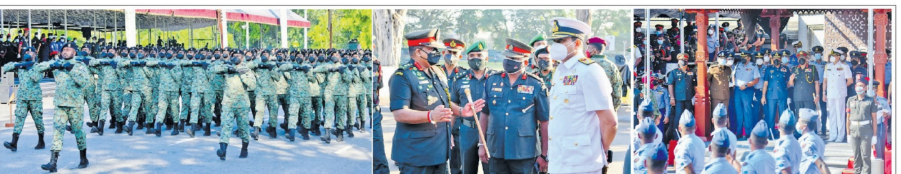
74ஆவது சுதந்திர தினத்தை முன்னிட்டு எதிர்வரும் 4ஆம் திகதி இடம்பெறவுள்ள சுதந்திர தின நிகழ்வுகளுக்கான தலைகளைக் கொழுப்பு சுதந்திர சதுக்கத்தில் இடம்பெற்ற வருகின்றன. இந்த ஒத்திகை நிகழ்வுகளில் நேற்று முன்தினம் (01) இராஜாங்க தளபதி ஜெனரல் சேவந்திர சிவன் உள்ளிட்ட பாதுகாப்புப் பிரிவினர் உயர் அதிகாரிகள் கலந்துகொண்டனர்.