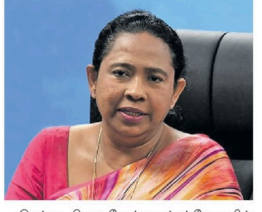
இதன்படி, பொது போக்குவரத்துச் சேவையின் தந்தை மெம்பெற்றும் வகையில், கடுமையான முறையில் நிர்வகிக்கப்படும் என்ற கட்டிக்காட்டியுள்ளார்.

பொது போக்குவரத்துச் சேவையானது கடுமையான முறையில் நிர்வகிக்கப்பட்டு மென் போக்குவரத்து அமைச்சர் தெரிவித்துள்ளார். பொது போக்குவரத்துச் சேவைகள் தனிப்பட்ட மயமாக்கப்பட்டுள்ள போதிலும் பொது மக்களுக்குப் பொதுவான சேவை கிடைக்கவில்லை என போக்குவரத்து அமைச்சர் ஜான பவித்ரா என்விமாரச்சி தெரிவித்துள்ளார். மதுப்புரப் பலவகை போக்குவரத்து நிலையத்தில் இடம்பெற்ற நிகழ்வொன்றில் உரைபற்றும்போதே போக்குவரத்து அமைச்சர் இதனை தெரிவித்துள்ளார். இதுதொடர்பில் அவர் மேலும் குறிப்பிட்டுள்ளார். தற்போது போட்டி நிறைவு போக்குவரத்துச் சேவையை அவதானிக்கக்கூடியதாகவுள்ளது. அதே போன்று, பொது மக்களுக்கு போக்குவரத்துச் சேவையை இலகுவாகக் கிடைக்கச் செய்யும் முறையில் நிர்வகிக்கப்படும் என்ற கட்டிக்காட்டியுள்ளார்.