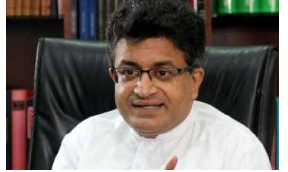
எனன். எனினும் அதனைக் கவனத்தில் கொள்ளவில்லை எனவும் உதய கம்மன்பில குறிப்பிட்டுள்ளார்.

காட்ட வேண்டும். பெருந்தொகையான எரிபொருளை விரயமாக்கிசுதந்திரனைவைவம் போன்ற அரச நிகழ்வுகளை நடத்துகின்றமை தவறு. அப்படியான வைவங்களை நடத்த வேண்டாம் என நான் அமைச்சரவையில் கோரி