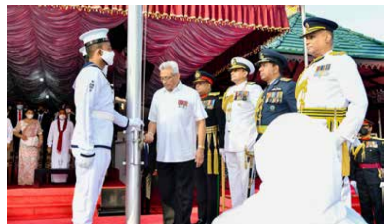
74ஆவது சுதந்திர தினமான நேற்று காலை ஜனாதிபதி கோட்டாபய ராஜபக்ஷ தேசியக் கொடியை ஏற்றிவைத்தபோது...!

நாடளாவிய ரீதியில் நேற்று சுதந்திர தின கொண்டாட்டம் கொழும்பு, பெப். 05 நாட்டின் 74ஆவது சுதந்திர தினம் நேற்று கோட்டாபய ராஜபக்ஷ தேசியக் கொடியை ஏற்றி - உரையாற்றி சுதந்திர தினக் கொண்டாட்டங்களை ஆரம்பித்து வைத்தார். சவால்களை முறியடித்து வளமான தாய்நாடு என்ற தொனிப்பொருளில் சுதந்திர சதுக்கத்தில் இடம்பெற்ற இந்த நிகழ்வில் பங்கேற்க சென்ற ஜனாதிபதியை நீர்ப்பாசன அமைச்சு உள்நாட்டு அலுவல், பாதுகாப்பு இராஜாங்க அமைச்சருமான சமல் ராஜபக்ஷ வரவேற்றார். இந்த நிகழ்வில் பிரதமர் மஹிந்த 15