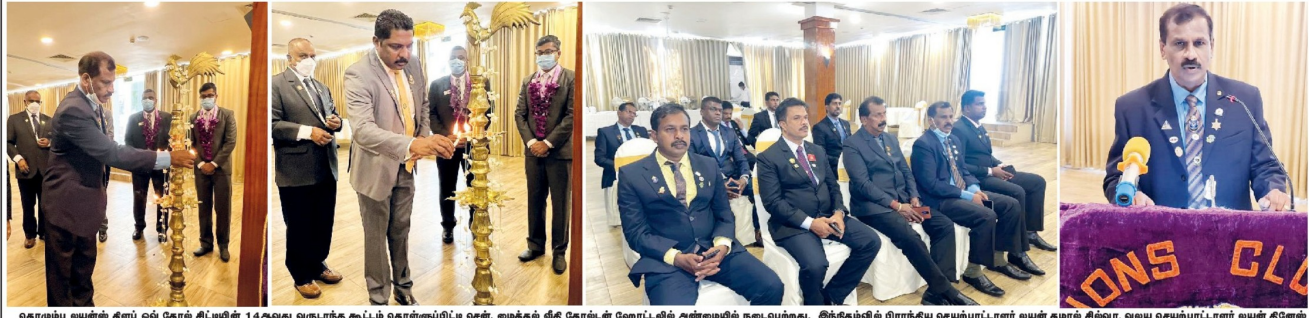
கொடும்பில் மீண்டும் ஒவ்வொரு சிபிஐயின் 14ஆவது வருபுத்த கூட்டம் களஞ்சியம் கட்டிடம் ஆரம்பிக்க ஆலிம் ஊக்க வழங்குதல்களை வழங்கி நட்டிவைக்கப்பட்ட நம்பினை பங்களிக்கும் காரணமாக (பங்களிக்கும் அநூராதபுரம் செய்தியாளர்)

பொலன்னறுவை சிங்கபுரத்தில் சம்பவம் (அநூராதபுரம் செய்தியாளர்) பொலன்னறுவை பகுதியிலுள்ள விடொன்றில் ஆறு இலட்ச ரூபாய்க்கும் அதிகம் பெறுமதி வாழ்ந்த தங்க நகைகளை கொள்ளையடித்த சம்பவமொன்று இடம்பெற்றதற்காக பொலிஸார் தெரிவித்தனர். இச்சம்பவம் கடந்த வெள்ளிக்கிழமை இரவு 11 மணியளவில் பொலன்னறுவை பொலிஸ் பிரிவினா சிங்கபுர பகுதியிலுள்ள விடொன்றில்