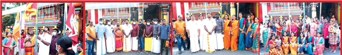
கொழும்பு 14, நவகம்புர ஸ்ரீ முத்துமாரியம்மன் தேவஸ்தானத்தில் இடம்பெற்ற சுதந்திர தின நிகழ்வுகளை படங்களில் காணலாம்.

போட்டிகளுக்கான பரிசு பொருட்களை அனுசரணையாக வழங்கிவைத்த தலைமுறை சம்பளம் அமைப்பெற்று கலந்து திறப்பிடுகின்றனர். பாடசாலையில் நீண்டநாள் தேவலாபை குறிப்பிடுகின்றனர். தீர்க்கு முகமாக சாவேரி கவர் மன்றம் முறையான அனுசரணை வழங்கி இருக்கையையும் குறிப்பிட்டுள்ளது.