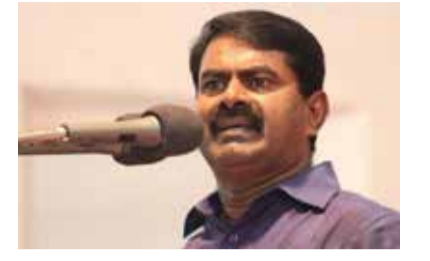
செயல்படுகிறார் என்று கூறும் அதிமுக, பா.ஜ.கவுடன் உள்ளாட்சித் தேர்தலில் கூட்டணி வைக்கவில்லை என்றாலும், மத்தியில் பா.ஜ.க. அதிகார மிக்கதாக இருப்பதால் அனுசரித்து செல்ல வேண்டும் என்பதால் பா.ஜ.கவிடம் நயந்து பேசுகிறார்கள்” என சீமான் இதன்போது தெரிவித்தார்.

தலைமை ஒருங்கிணைப்பாளர் சீமான், ஆளுநர் நீட் விலக்கு மசோதாவைத் திருப்பி அனுப்பியது குறித்து கருத்து வெளியிட்டார். “தமிழக ஆளுநர் பா.ஜ.கவால் நியமிக்கப்பட்டவர் ஆர்எஸ்எஸ் உறுப்பினர். அவர்கள் நீட்டை ஆதரிக்கிறார்கள். அப்படி இருக்கும்போது எப்படி அவர் நீட் தேர்வுக்கு எதிராகச் செயல்படுவார்? செயல்பட மாட்டார். அதுதான் அவர்களது கோட்பாடு. ஆளுநர் சட்டப்படி