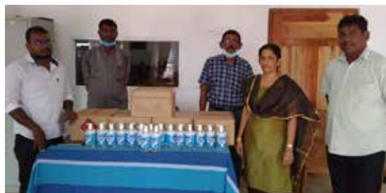
நிறுவனத்தின் நிர்வாகத் தினரிடம் கையளிக்கப்பட்டது. (அ)

வலுவூட்டல் இணையத்துக்கு முன்னாள் கல்வி இராஜாங்க அமைச்சர் விஜயகலாமகேஸ்வரனின் முயற்சியால் கிடைக்கப்பெற்ற ஒரு தொகுதி தொற்றுநீக்கி மருந்து பொருட்கள் நேற்று