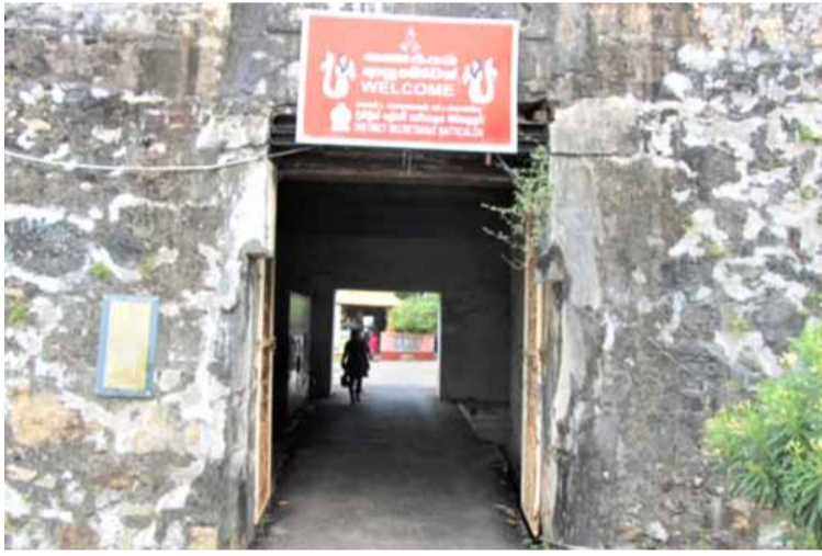
மாவட்டத்தின் முக்கிய சுற்றுவளாகத் தளமாக இருக்கும் இவ்வால்லாந்தர் கோட்டையினைப் பார்வையிட அதிகமாள