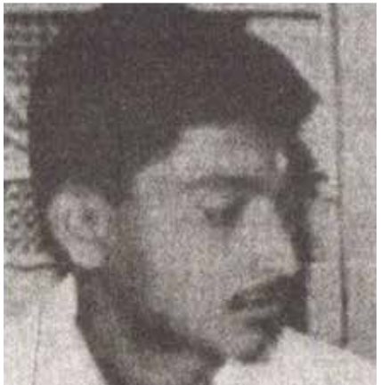
1971 இல் பிரபாகரன்