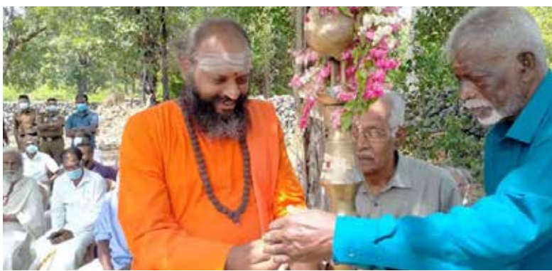
சிறப்பு அதிதியாக கலந்துகொண்டு உரையாற்றிய போதே அவர் இவ்வாறு தெரிவித்துள்ளார். தொடர்ந்து கருத்து தெரிவித்த அவர் மேலும் தெரிவித்தவை வருமாறு:-

யாழ் நெடுந்தீவு செல்லம்மாள் வித்தியாலய வளாகத்தில் சிவன் மானுட மேம்பாட்டு நிறுவனத்தின் ஏற்பாட்டில் செல்லம்மாள் குடும்பகார்த்த அறநெறி பாடசாலை மற்றும் செல்லம்மாள் குடும்பகார்த்த முன்பள்ளி ஆகிய வற்றுக்கான அடிக்கல் நாட்டு விழா திங்கட்கிழமை நடைபெற்றது இதில்