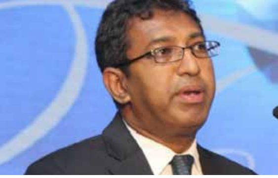
ஊழியர் சேமலாப நிதியம் மற்றும் ஓய்வூதிய கொடுப்பனவு நிதி என்பவற்றை மேலதிக வரிச் சட்டமூலத்தில் உள்ளடக்குவதற்கான சரத்துக்கள் தயார் செய்யப்பட்டன.