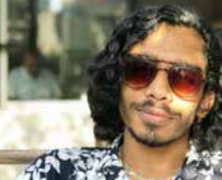
கொழும்பில் கடந்த வெள்ளிக்கிழமை காணாமல்போன இளைஞன் உயிரி

முந்த நிலையில் மீட்கப்பட்டமை தொடர்பான விசாரணைகளுக்காக மாலைதீவு பொலிஸார் இலங்கை வந்துள்ளனர். வெள்ளாவத்தை கடற்கரையில் மீட்கப்பட்ட இரண்டு சடலங்களில் ஒரு சடலம் காணாமல் போன மாலைதீவைச் சேர்ந்த வருடையது என அடையாளம் காணப்பட்டுள்ளது எனப்பொலிஸார் தெரிவித்துள்ளனர். இது தொடர்பான விசாரணைகள் இடம்பெறுகின்றன எனத் தெரிவித்துள்ள பொலிஸார், மாலைதீவு பொலிஸாரும்