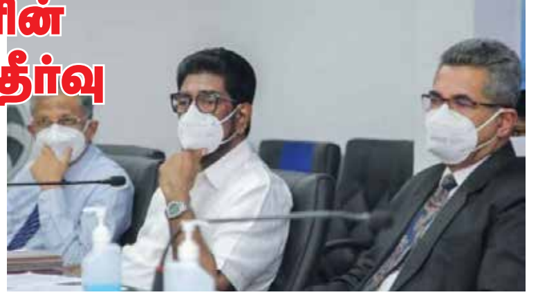
முகங்கொடுத்துள்ளார்கள். நாடளாவிய ரீதியில் 65 ஆயிரம் சுகாதாரத் துறை ஊழியர்கள் இந்த வேலை நிறுத்தத்தில் ஈடுபட்டுள்ளமை குறிப்பிடத்தக்கது.

தொழிற்சங்கங்கள் முன்வைத்துள்ள கோரிக்கைகள் தொடர்பில் கவனம் செலுத்தி நியாயமான பிரச்சினைகளுக்கு விரைவில் தீர்வு வழங்கப்படுமென்று சுகாதார அமைச்சர் கெஹலிய ரம்புக்வேல்ல தெரிவித்துள்ளார். உரிய தொழிற்சங்கங்கள் முன்வைத்துள்ள சில கோரிக்கைகளுக்குத் துரிதமாக தீர்வு வழங்க முடியும். இது தொடர்பாக இருதரப்பிற்கும் இடையில் இணக்கப் பாடு எட்டப்பட்டதாகவும் அமைச்சர் கூறினார். தொழிற்சங்கப் பிரதிநிதிகளுடன் சுகாதார அமைச்சர் சில் நேற்று (செவ்வாய்க்கிழமை) இடம்பெற்ற சந்திப்பின் போது அமைச்சர் இவ்வாறு குறிப்பிட்டார். தொழிற்சங்கங்கள் முன்வைக்கும் சில கோரிக்கைகள் பற்றி கவனம் செலுத்துவதற்காக இரண்டு வாரங்கள் தேவைப்படுகின்றன எனவும் அமைச்சர் கூறினார். இதேவேளை, அமைச்சருடன் இடம்பெற்ற பேச்சுகள் தோல்வியடைந்தமையால் வேலை நிறுத்தத்தை தொடர்ந்தும் முன்னெடுப்பதாக சுகாதாரத் தொழிற்சங்கங்கள் அறிவித்துள்ளன. 7 கோரிக்கைகளை முன்வைத்து 18 தொழிற்சங்கங்கள் வேலைநிறுத்தத்தில் ஈடுபட்டுள்ளன. இதனால், நோயாளர்கள் பாரிய சிரமங்களுக்கு