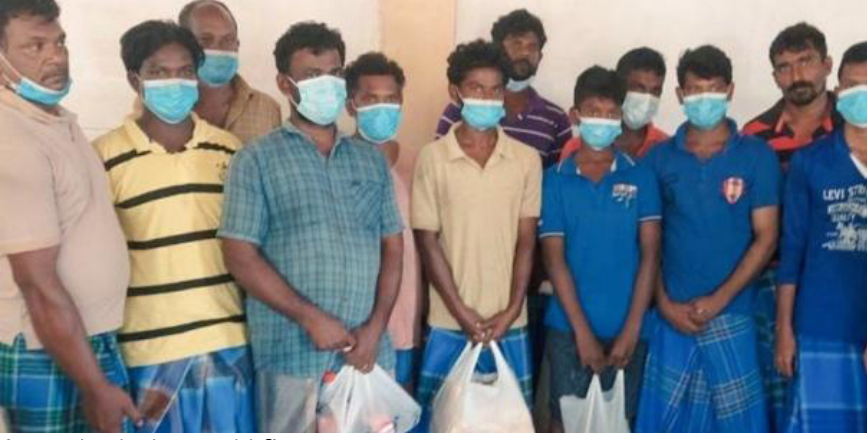
(08ஆம் பக்கத் தொடர்ச்சி) அரசனை நம்பி...

இருநாட்டுமீனவப் பிரச்சினை என்பது, இரு கடற்கொழிப் சமுதாயங்களை சார்ந்தது. அதற்கு அப்பால், இரு நாட்டு அரசு சார்ந்த அரசியல் பிரச்சினை. இது தவிர்க்க முடியாதது. அதே சமயம், அதனையே சர்வதேச பிரச்சினையாக ஆக்க முயல்வது, அவ்வகையிலே உரவை இடித்த கதையாகவே முடியும்.