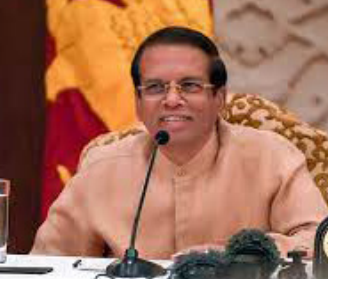
விடுக்கப்பட்ட அழைப்பை ஏற்றே அவர் அங்கு சென்றுள்ளார். அவருடன் மேற்படி விஜயத்தில் மேலும் இருவர் இணைந்து கொண்டுள்ளனர் எனவும் தெரிவிக்கப்படுகின்றது.

முன்னாள் ஜனாதிபதி மைத்திரிபால சிறிசேன தென்கொரியாவிற்கு விஜயம் செய்துள்ளார். அவர் நேற்று (வியாழக்கிழமை) அதிகாலை 12.45 மணியளவில் சிங்கப்பூர் ஏர்லைன்ஸ் விமானமான எஸ்கியூ-468 இல் சிங்கப்பூர் வழியாக தென்கொரியா நோக்கி அவர் பயணித்தார். தென்கொரியாவில் நடைபெறவுள்ள உலக சமாதான உச்சிமாநாட்டில் சிறப்புரையாற்றும்படி