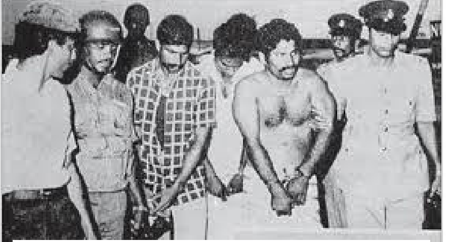
குட்டிமணி, தங்கத்துரை, தேவன் கைதான போது....