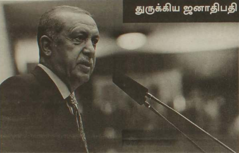
துருக்கிய ஜனாதிபதி ரஜப் தய்யிப் அர்துகான்

சலூதி அரேபிய ஊடகவியலாளர் ஜமால் கஷுகி ஸ்தான்பூலிலுள்ள சலூதி அரேபிய துணைத் துறாகத்தினுள் கொலை செய்யப்பட்டமை ஒரு திட்டமிடப்பட்ட அரசியல் படுகொலை என துருக்கிய ஜனாதிபதி ரஜப் தய்யிப் அர்துகான் தெரிவித்துள்ளார்.