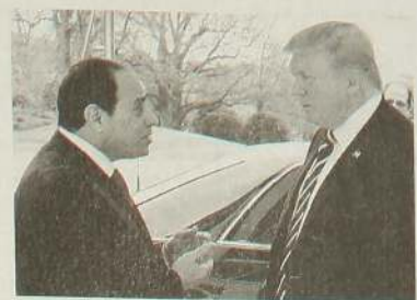
"எகிப்துக்கும் அமெரிக்காவுக்கும் இடையிலான பரஸ்பர புரிதலும்

மத்திய கிழக்குப் பிராந்தியத்தின் ஸ்திரீப்பாட்டை பேணிப் பாதுகாப்பதில் எகிப்தின் ஜனாதிபதி அப்துல் பத்தாஹ் சீஸி ஐக்கிய அமெரிக்காவுக்கு மிகவும் முக்கியமானவர் என்று அமெரிக்க ஜனாதிபதி ட்ரம்ப் தெரிவித்துள்ளார். ஏற்கனவே சீஸியின் தலைமையில் எகிப்து பல சாதனைகளை நிலை நாட்டியுள்ளது என்று ஜனாதிபதி ட்ரம்ப் சீஸியைப் பாராட்டியுள்ளார்.