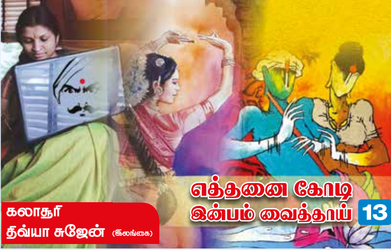
கலாதூர் த்வயா சுஜேன் (கலைவகை)

வானோர்க் கேணும் மாதரின்பம் போற்பிறிதோர் இன்பம் உண்டோ?