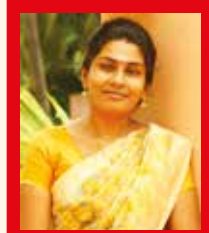
பொல்கையூர் ரீகா (இலங்கை)

அவர்கள் நம் பதட்டத்தின் மீது பணம் பாக்கிறார்கள் என்பது புரிந்து அது குறித்து நாம் கேள்வி கேட்டால் எதிரியாகி விடுவோம். இல்லாதவற்றைக் கூட அதிகப்படியாக உருவாக்கி நம்மைத் தவறென்று கூறுவார்கள். அவர்கள் பிழையென்பதை மறைத்தாக வேண்டுமே. [எங்கும் தவறுகளைக் கேள்வி கேட்பது அதை உரியவர்களுக்குப் பிடிக்காததுதான்]