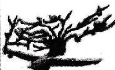
உயிர்ப்பைத் தீரும் வீரர்கள்

ம னிதனிடத்தில் குடி கொண்டிருக்கும் நீசத்தனம் என்னை வெறுப்படையச் செய்திருக்கிறது. பொய், மொற்றுதல், கபடம், வஞ்சகம் என்பவற்றை என்னால் சகிக்க முடியாது. எப்போதும் உத்தமனாகவே வாழ வேண்டும் என விரும்புகிறேன். அப்படி வாழ முடியாது என்பதும் எனக்குத் தெரியும். அதற்காக எல்லாரும்தான் போகும் வழியிலேயே செல்ல வேண்டும் என்று நான் எண்ணவில்லை. அப்படி நானும் நீங்களும் என்னை நடந்தால், உண்மையான மனிதனை, ஒரு சான்றோனை - இந்த உலகம் காண முடியாது போகும், இது எனக்காக மட்டும், என்னைப் பற்றி மட்டும் சொல்லவில்லை. அதனால் எனக்கு நான் தனி வழி அமைத்து நடக்கின்றேன். வெளியுலக விஷயங்கள் எனது உள்ளத்தை அவ்வளவாகப் பாதிப்பதில்லை. விஷயங்களை நான் அப்படியே நடக்கும் என்று ஒத்துக் கொள்கிறேன், அல்லது விட்டு விடுகிறேன். இது எல்லாபாடும் சாத்தியமானதா?