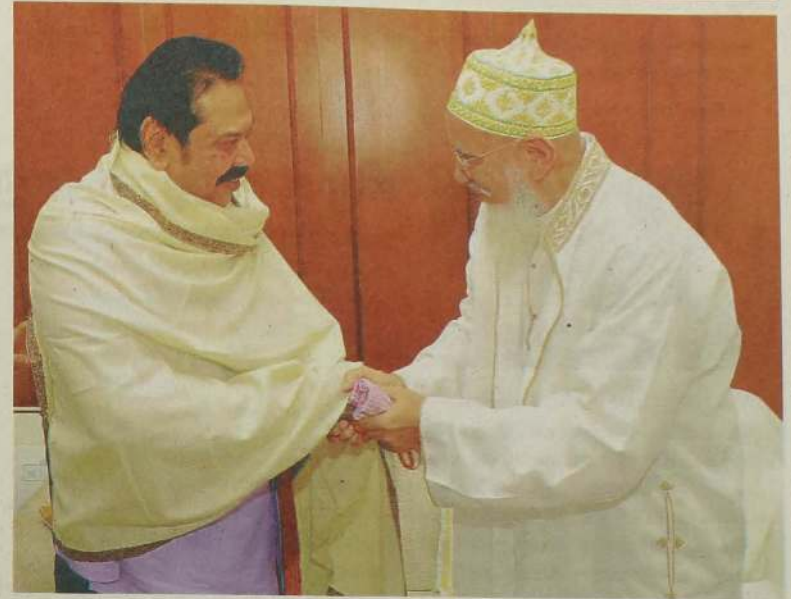
உலக போரா சமூகத்தின் ஆன்மீகத் தலைவர் கலாநிதி முப்துஸ்ஸை இலங்கைக்கு மேற்கொண்ட குறுகிய விஜயத்தின் போது எதிர்க்கட்சித் தலைவர் மஹிந்த ராஜபக்ஷவை அழைத்து ஆசி வழங்கினார். மஹிந்த ராஜபக்ஷ ஜனாதிபதியாக இருந்த காலத்தில் பஹுரைன் விஜயத்தின் போது அவருக்கு கலீபா பட்டமும் வழங்கப்பட்டது.

தேசங்களிலும் சிலைகள் உடைக்கப்பட்டிருக்கின்றன. பெளத்த சிலைகள் மட்டுமன்றி இந்து, கிறிஸ்தவ வழிபாட்டுச் சின்னங்களும் உடைக்கப்பட்டிருக்கின்றன. அந்த வகையில் மன்னார், திருகோணமலை, காத்தான்குடி போன்ற பிரதேசங்களில் எல்லாம் இந்தச் சிலை உடைப்புடன் சம்பந்தப்பட்டவர்களைத் தொடர்பிடுவதாக நாங்கள் சந்தேகிக்கிறோம். இவர்கள் தாமத இயங்கவில்லை. (பக். 02)