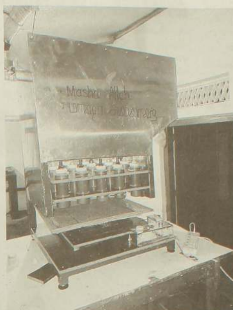
யம் சடுபட்டு வருவதாகவும் குறிப்பிடுகின்றார்.