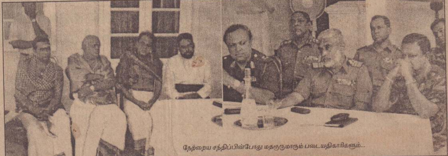
நேற்றைய சந்திப்பின்போது மதகுருமாரும் படையதிபரிகளும்...

நிலைமை இவ்வாறு இருந்த போதும், ஜி.சீ.ஈ. உயரதரத் தகைமையுடன் ஆசிரியர் சேவைக்கு விண்ணப்பித்தவர்களுக்கான (16ஆம் பக்கம் பார்க்க)