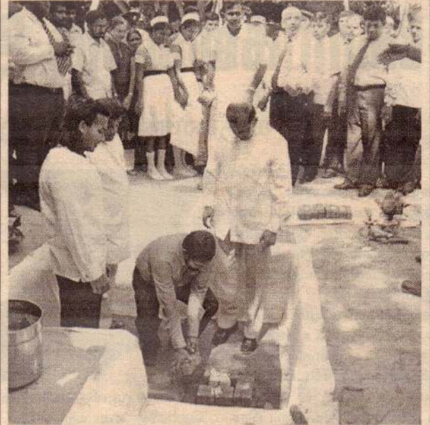
முல்லைத்தீவு, ஜூன் 25 முல்லைத்தீவு மாஞ்சோலை பிரதான வைத்தியசாலையில் சத்திர சிகிச்சைப் பிரிவின் நிர்மாணப்பணிகள் ஆரம்பித்து வைக்கப்பட்டுள்ளன. அமெரிக்க நிறுவனமொன்று இதற்கென 236 மில்லியன் ரூபாவை வழங்கியுள்ளது.