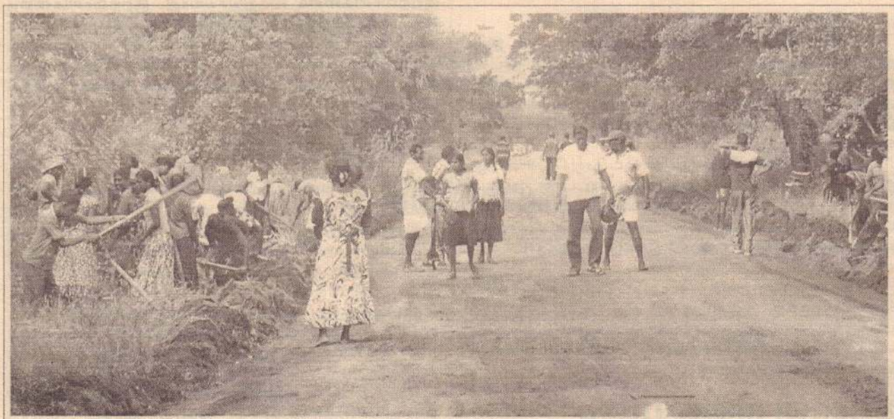
மல்லாவியிலிருந்து ஐயன்கன்குளம் செல்லும் வீதியின் புனரமைப்பு வேலைகளில் பொது மக்களும் இராணுவத்தினரும் இணைந்து ஈடுபட்டுள்ளனர். (18)

42 பாடசாலைகளில் உலக உணவுத் திட்டத்தின் கீழான உணவுகளைச் சமைப்பதற்கு சமையல்கூட வசதிகள் இல்லை. துணுக்காய் கல்வி வலயத்திலுள்ள 42 பாடசாலைகளில் உலக உணவுத் திட்டத்தின் கீழான உணவுகளைச் சமைப்பதற்கு சமையல்கூட வசதிகள் இல்லை. அரச அதிபர் சமையல் கூடங்களை அமைப்பதற்கு உதவுவதாகத் தெரிவித்துள்ளார் எனவும் அவர் மேலும் தெரிவித்தார். (க-18)