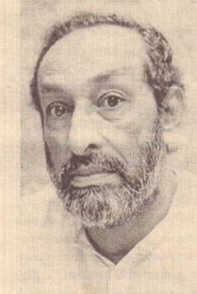
உறுதிப்படுத்தப்பட்டுள்ளது என்று அவர் கூறினார். இந்த மொழி உரிமைச்

தமது பணிகளைச் செய்து கொள்ளலாம் என்று அரசியலமைப்புச் சட்டத்தில்