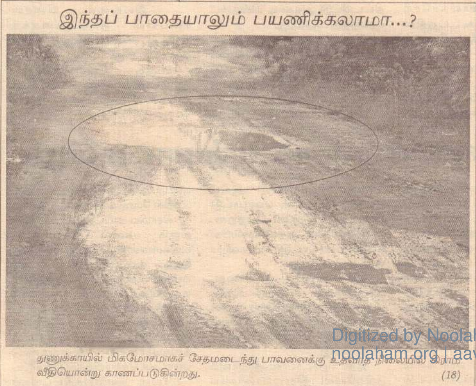
துணுக்காயில் மிகமோசமாகச் சேதமடைந்து பாவனைக்கு உதவாத நிலையில் இராம வீதியொன்று காணப்படுகின்றது. (18)

சந்தையின் மீன், மரக்கறி விற்பனைப் பகுதிகளின் கட்டுமானப் பணிகள் எதிர்வரும் மாதத்தில் முடிவடையவுள்ளன. 46 மீன் விற்பனை நிலையங்களும், 64 மரக்கறி விற்பனை நிலையங்களும் முதலாவது கட்டுமானப் பணிகளில் உள்ளடங்கியுள்ளன. ஏனைய வியாபாரிகளுக்கென தற்காலிக கட்டுமானங்களை அமைத்து வியாபார முயற்சிகளை ஆரம்பிப்பதெனவும் முடிவுகள் மேற்கொள்ளப்பட்டுள்ளன. புதிதாக அமைக்கப்படும் சந்தையில் ஒரே நேரத்தில் சகல வியாபாரங்களையும் முன்னெடுப்பதெனவும், புதிய கட்டடங்களுக்கான நிதி தாமதமடைவதால் இந்த முடிவுகள் எடுக்கப்பட்டுள்ளன எனவும் அவர் மேலும் தெரிவித்தார். (க-18)