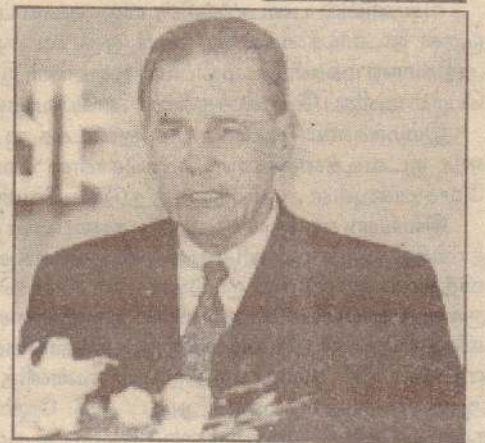
சர்வதேச ஒலிம்பிக் குழுத் தலைவர் ஜக்கு யிஸ் ஹோஜ் வரவேற்புரையாற்றுகின்றார்.

குழுக்களின் இசைகள் என அனைத்தும் கண்களைக் கவர்ந்தன. தொடக்க விழா நிகழ்ச்சி இரண்டு கட்டங்களாக இடம்பெற்றது. சீனாவில் பாரம்பரியம் மற்றும் நவீன சீனாவின் வளர்ச்சி ஆகியவற்றைப் பற்றிச் சாற்றும் வகையில் கலைவிழா நடைபெற்றது. அதன் பின் வீரர்களின் அணி வகுப்பு உள்ளிட்ட நிகழ்ச்சிகள் இரண்டரை மணி நேரம் நடைபெற்றன.