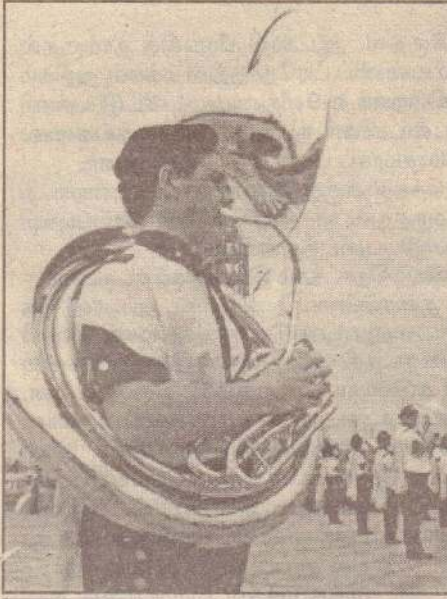
பாண்ட் வாத்திய அணிவகுப்பு

பறவைக் கூடு வடிவில் அமைக்கப்பட்ட தேசிய அரங்கில் நிகழ்வு மூன்றரை மணி நேரம் இடம்பெற்றது.