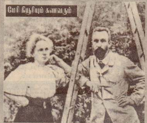
கண்டனத்துக்குரிய உலகத்தில் வாழவே எனக்குப் பிடிக்கவில்லை. என்னால் ஏற்படும் இழப்பு இந்த உலகத்திற்கு மிகச் சிறியதாகவே இருக்கும்" என்று ஓர் இளம் மாணவி, காதல் தோல்வியைத் தாள் முடியாமல் தன் ஒன்றுவிட்ட தங்கை ஒருத்திக்குக் கடிதம் எழுதினாள்.

விவரம் புரியாத இந்த உலகத்திற்கு விடை கொடுத்துவிட்டு நான் போக விரும்புகிறேன். இங்கே உண்மையான அன்புக்கும், தூய்மையான காதலுக்கும் எள்ளவுசூட மதிப்பில்லை. இந்தக்