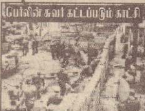
பெர்லின் சுவர் கட்டப்படும் காட்சி

*கரீபியன் கடலையும் பசுபிக் கடலையும் இணைக்கும் பனாமாக் கால்வாய் 1914 ஆம் ஆண்டு ஒகஸ்ட் 15 இல்தான் திறக்கப்பட்டது. *****