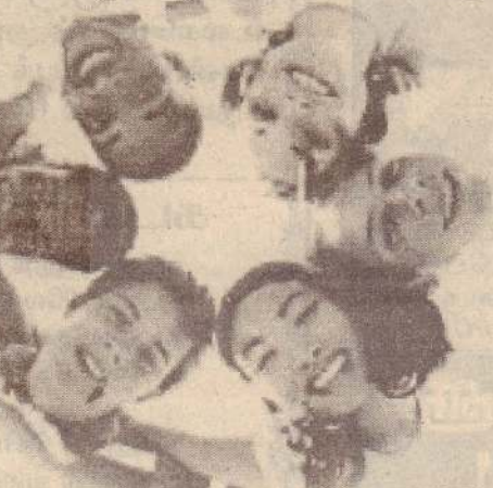
நமது திறமையை நாமே மதிப்பீடு செய்து கொள்ளவேண்டும். அதன் விளைவாக இதை நம்மால் செய்ய முடியும் என்ற முடிவுக்கு வந்து

நம்பிக்கை என்பது தன்னுணர்வின் வெளிப்பாடு. நம்மால் எதைச் செய்ய முடியும் என்பது பற்றிய உணர்வு முதலில் வர வேண்டும். அதாவது