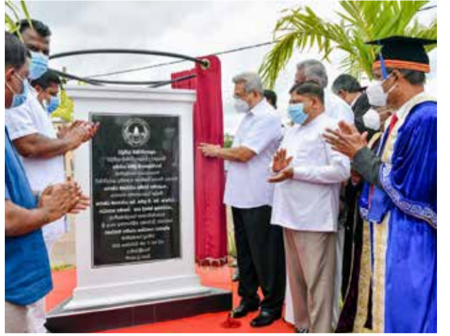
நாட்டின் 17 ஆவது பல்கலைக்கழகமான வவுனியா பல்கலைக்கழகத்தை ஜனாதிபதி கோட்டாபய ராஜபக்ஷ நேற்று திறந்து வைத்தார். (தொடர்புடைய செய்திகள் பக்கம் 10இல்)