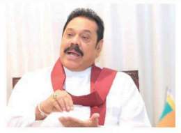
நிழல் மற்றும் அறநெறிப் பாடசாலை மாணவர்களின் திறமைகளை தேசிய நிழல் ஆய்விதழை நடைமுறைக்கு கொண்டுவர ஆலோசனை வழங்கினார்.

அகில இலங்கை சாசனார்க்கு சபையில் தற்போது நிலவும் பிரச்சினைகளை தீர்ப்பதற்கு நடவடிக்கை மேற்கொள்ளுமாறு பிரதமர் மஹிந்த ராஜபக்ஷ நேற்று முன்தினம் (10) பிரதமர் அறிவுறுத்தல் செய்துள்ளார். (10) பிரதமர் அறிவுறுத்தல் செய்துள்ளார். அமைச்சர் அமைச்சர் செயலாளர் உள்விட அதிகாரிகளுக்கு ஆலோசனை வழங்கினார்.