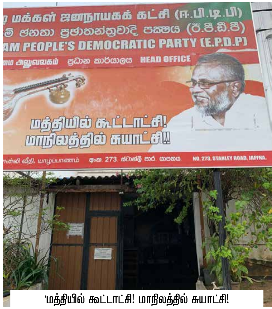
'மத்தியில் கூட்டாட்சி! மாநிலத்தில் சுயாட்சி!'